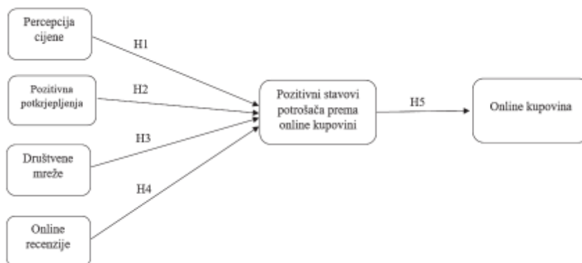
Slika 2: Model utjecaja na online kupovinu