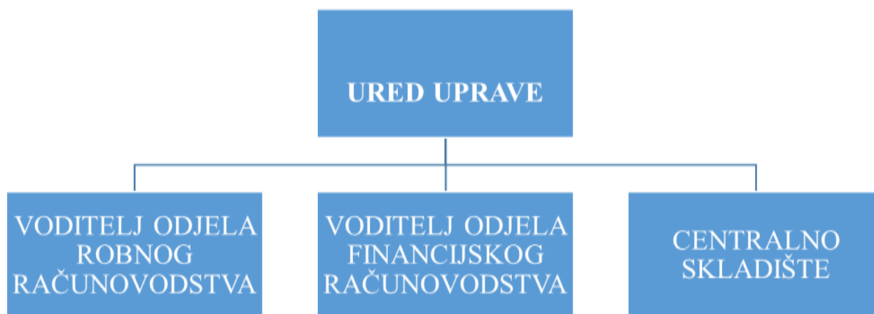
Slika br. 1.: Organizacijska struktura poduzeća Nird d.o.o., Kaštel Lukšić