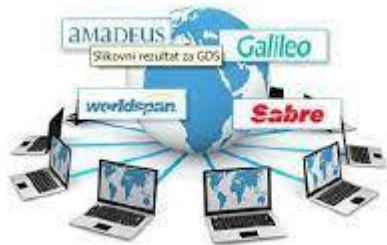
Slika 2. Prikaz Globalnog distribucijskog sustava(GDS)