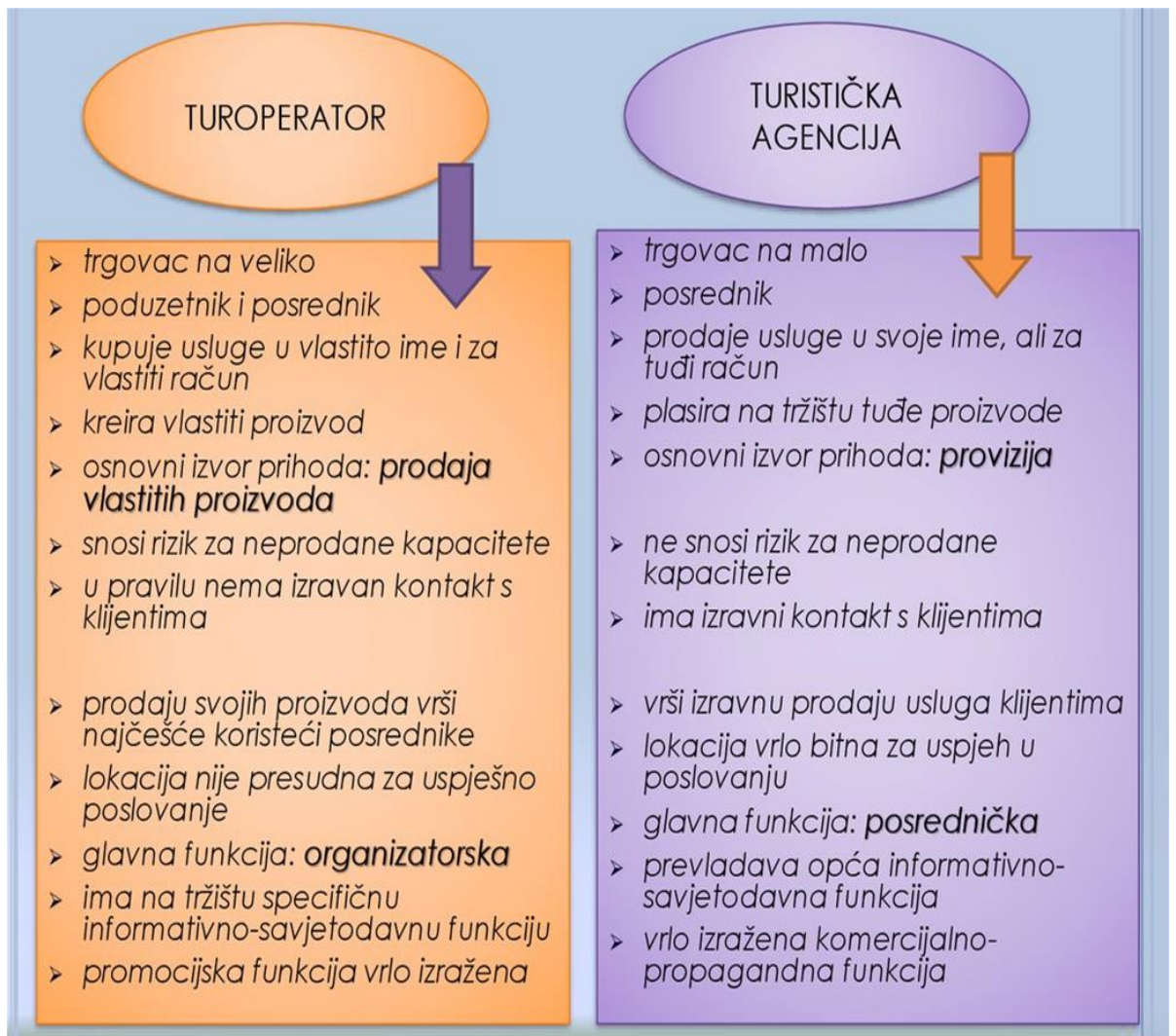
Slika 1. Usporedba pojma turoperator i turistička agencija