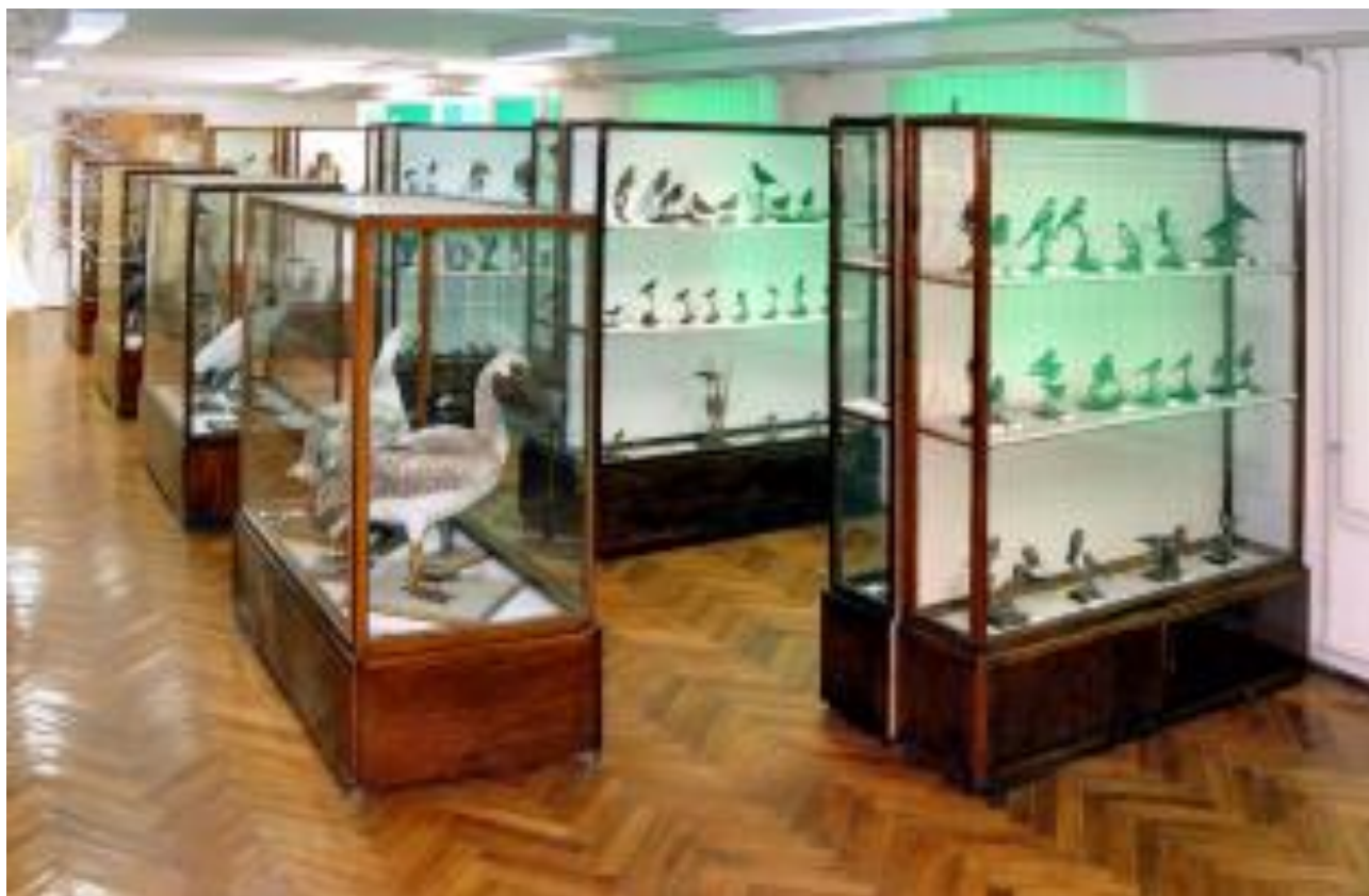
Slika 11. Ornitološka zbirka u Metkoviću, pristup: 23.8.2023. https://hr.wikipedia.org/wiki/Ornitolo%C5%A1ka_zbirka_u_Metkovi%C4%87u

Kada se govori o vrstama turizma, seoski je turizam najidealniji e za razvoj u neretvanskom području. Kako bi se on razvijao potrebno je stalno poticati sređivanje okućnica te svih komunalnih sadržaja. Za razvoj seoskog turizma nužno je raditi na unapređenju određenih ugostiteljskih ponuda i lokalnih namirnica (mandarine i sl.).