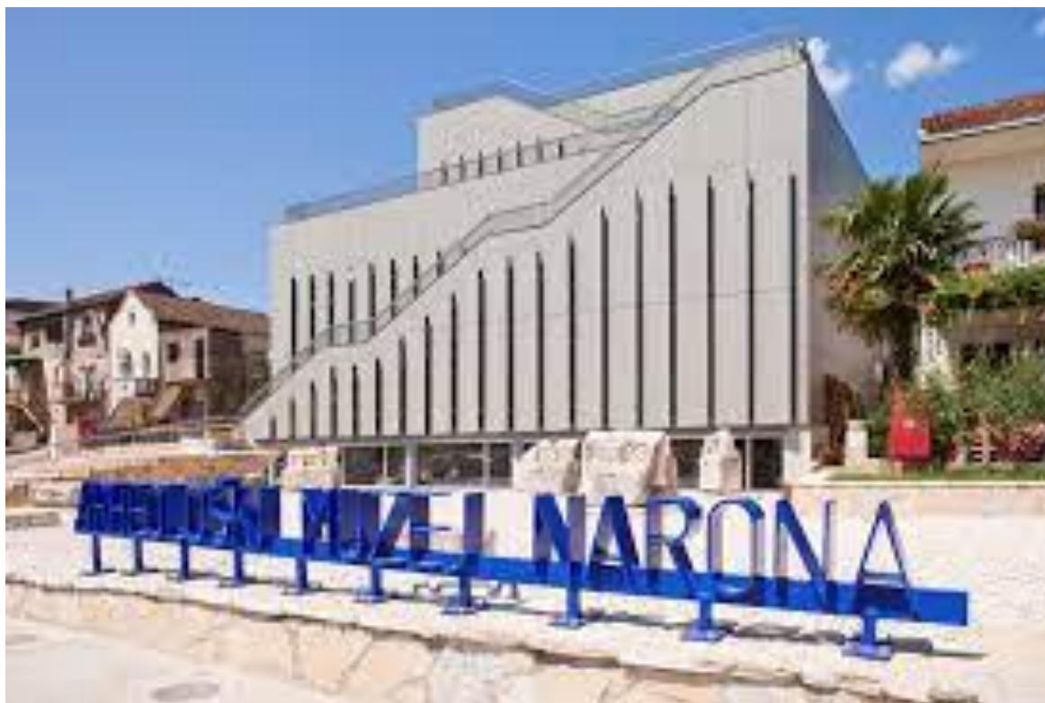
Slika 5. Arheološki muzej Naronu u mjestu Vid pored Metkovića, pristup: 10.8.2023 https://hr.wikipedia.org/wiki/Arheolo%C5%A1ki_muzej_Naronu

Osim kulturno-povijesne materijalne baštine nužno je istaknuti i nematerijalnu baštinu koja se ističe brojnim kulturnim i turističkim manifestacijama. Jedna od najpoznatijih atrakcija i događaja je Maraton lađa, koji predstavlja jedno od najpoznatijih atrakcija na području Republike Hrvatske. Po brojnosti sudionika također je jedan od najvećih manifestacija na ovom području jer sudjeluje oko 35 posada, od kojih svaka broji po 18 članova. Maraton lađa amatersko je športsko natjecanje u utrci lađa, tradicijskih autohtonih plovila u dolini Neretve s dužinom rute od 22,5 km. Održava se jednom godišnje, druge subote u kolovozu, pod pokroviteljstvom hrvatskoga predsjednika, a u organizaciji Udruge lađara Neretve. Prvi maraton održan je 13. rujna 1998. godine u sklopu obilježavanja sedme obljetnice akcije Hrvatske vojske Operacija Zelena tabla - Mala bara. Može se reći da ga uživo gleda nekoliko desetaka tisuća gledatelja duž cijele rute, što uz obalu Neretve, što u turističkim i privatnim brodovima, kao i iz (za tu prigodu) posebno organiziranog vlaka. Nadalje, osim Maratona lađa, od ostalih poznatih manifestacija u dolini Neretve potrebno je istaknuti smotru folklora „Na Neretvu misečina pala“ te festival