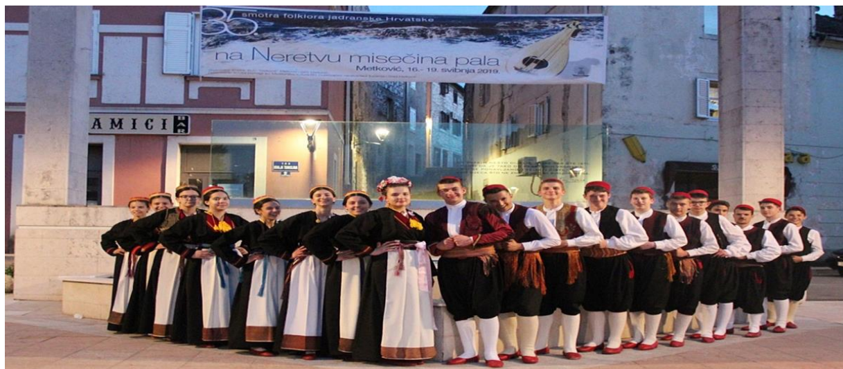
Slika 7. „Na Neretvu misečina pala“ – smotra folklornih udruga, pristup: 23.8.2023.

https://mreza.hr/post?p=37-smotra-folklora-jadranske-hrvatske-na-neretvu-misecina-pala-2d7f2