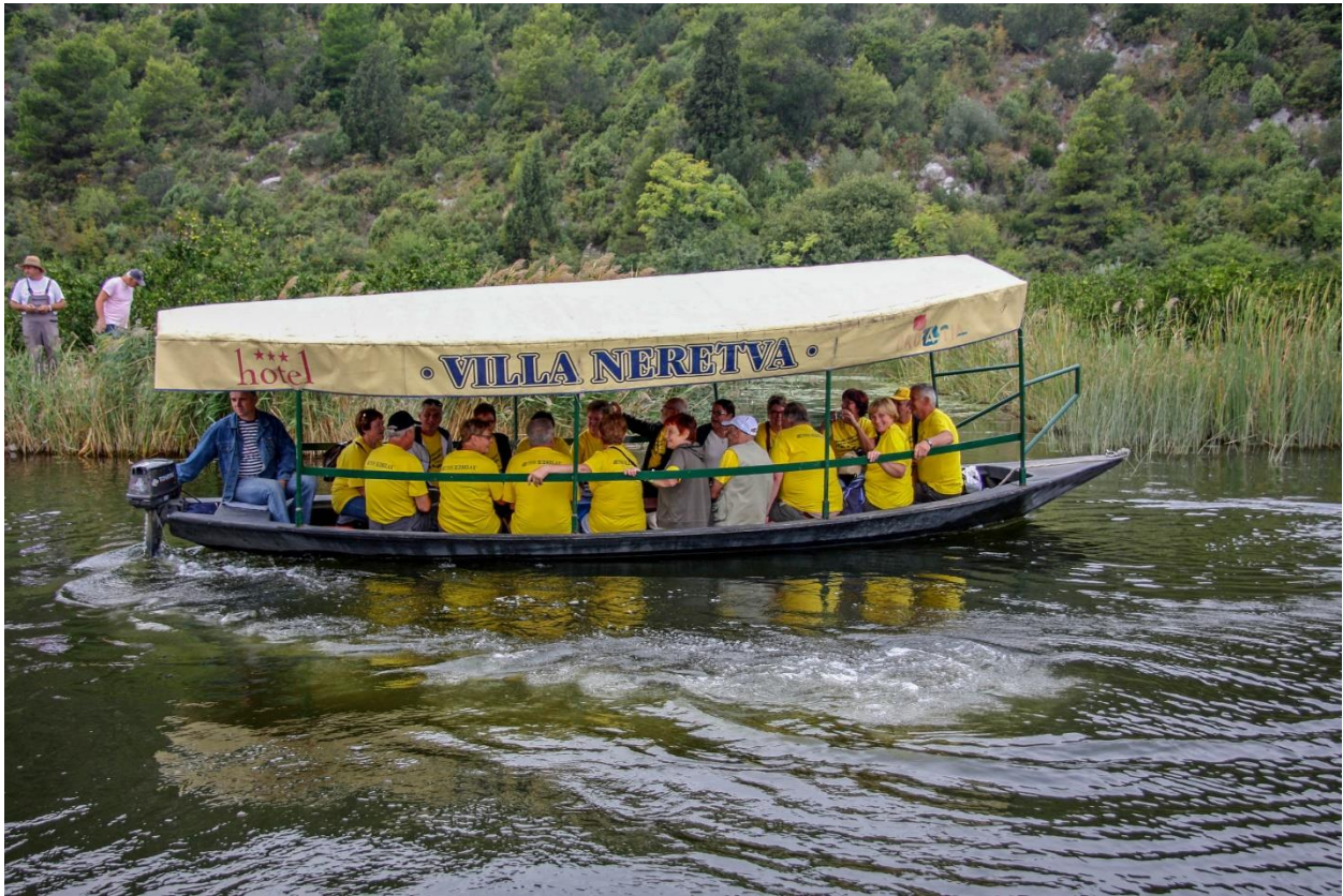
Slika 10. Safari izleti kroz Neretvu, pristup: 22.8.2023. https://www.aep-zabac.com/fotosafari/

atrakcija, u kojoj će turisti moći uživati u kulturnoj i prirodnoj baštini, rijeci Neretvi, Jadranskom moru koje je također blizu te u obilascima različitih vrsta gradova. Ruralni turizam trebao bi dosegnuti svoj maksimum te će dolina Neretve i dalje biti najpoznatija po izvozima različitih poljoprivrednih proizvoda.