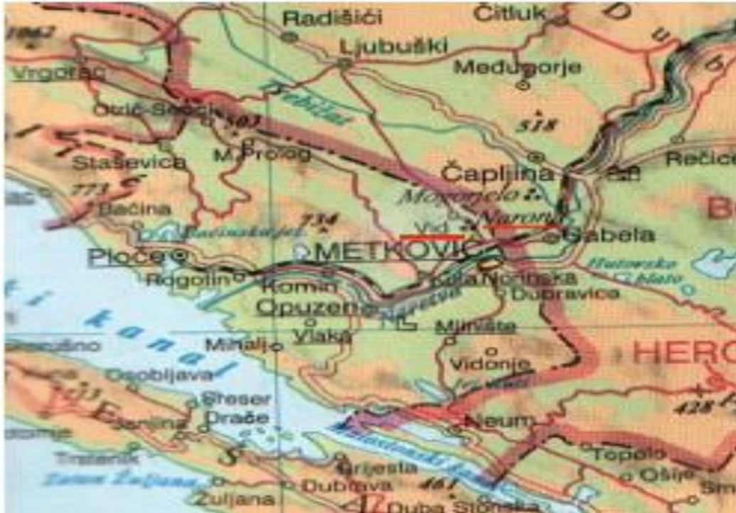
Slika 2. Područje Neretvanske doline, pristup: http://hrvatska.euco.in/?page_id=45 5.8.2023.