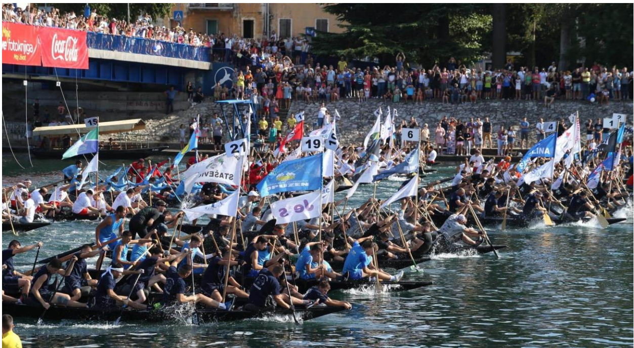
Slika 6. Maraton lađa u Metkoviću, pristup: 15.8.2023. https://metkovic-news.com/sport/26-maraton-lada-veslat-ce-29-ekipa-a-10-maraton-ladarica-12-ekipa/

zabavne glazbe Opuzen „Melodije Hrvatskog juga“, kojima se teži očuvati tradicijske vrijednosti neretvanskog područja. Također, potrebno je istaknuti kako se svake godine održava manifestacija u sklopu Turističke zajednice grada Metkovića i Arheološkog muzeja Naroni pod nazivom „Rimska noć u Naroni“ na kojoj se posjetitelji upoznaju s rimskom mitologijom. Također, svake godine se u kolovozu održavaju Dani Neretvanske kneževine tijekom kojih se održavaju različiti programi, manifestacije i igre u sklopu povezivanja i spajanja različitih kultura i običaja.