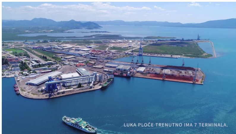
Slika 1. Luka Ploče, pristup: https://www.luka-ploce.hr/ 4.8.2023.

Kada se govori o željezničkom prometu, potrebno je istaknuti kako područjem Neretvanske doline prolazi samo jedna željeznička pruga, i to od Ploča preko Metkovića prema Sarajevu te predstavlja dio paneuropskog koridora 5C. Od 2014. godine ukinuta je linija Ploče -Metković za prijevoz putnika i danas se koristi isključivo u svrhu prijevoza tereta za potrebe Luke Ploče (Luka Ploče, 2011).