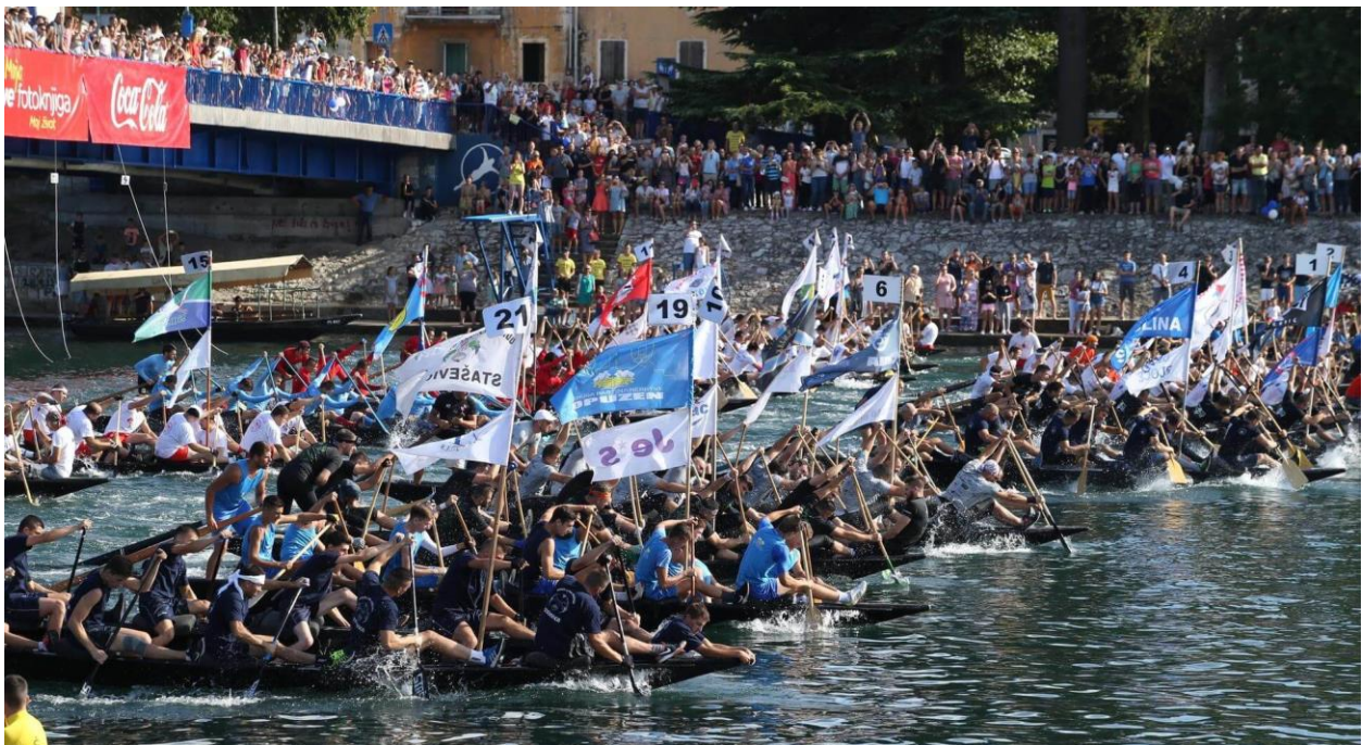
Slika 6. Maraton lađa u Metkoviću, pristup: 15.8.2023. https://metkovic-news.com/sport/26-maraton-lada-veslat-ce-29-ekipa-a-10-maraton-ladarica-12-ekipa/

zabavne glazbe Opuzen „Melodije Hrvatskog juga“, kojima se teži očuvati tradicijske vrijednosti neretvanskog područja. Također, potrebno je istaknuti kako se svake godine održava manifestacija u sklopu Turističke zajednice grada Metkovića i Arheološkog muzeja Naroni pod nazivom „Rimska noć u Naroni“ na kojoj se posjetitelji upoznaju s rimskom mitologijom. Također, svake godine se u kolovozu održavaju Dani Neretvanske kneževine tijekom kojih se održavaju različiti programi, manifestacije i igre u sklopu povezivanja i spajanja različitih kultura i običaja.