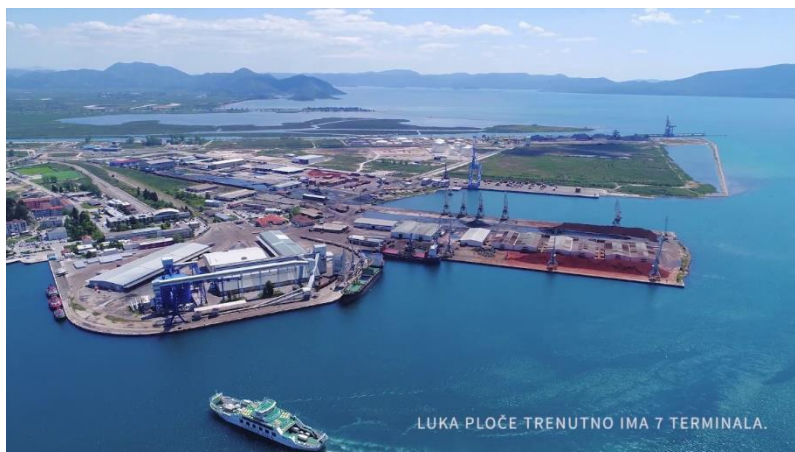
Slika 1. Luka Ploče, pristup: https://www.luka-ploce.hr/ 4.8.2023.

Kada se govori o željezničkom prometu, potrebno je istaknuti kako područjem Neretvanske doline prolazi samo jedna željeznička pruga, i to od Ploča preko Metkovića prema Sarajevu te predstavlja dio paneuropskog koridora 5C. Od 2014. godine ukinuta je linija Ploče -Metković za prijevoz putnika i danas se koristi isključivo u svrhu prijevoza tereta za potrebe Luke Ploče (Luka Ploče, 2011).