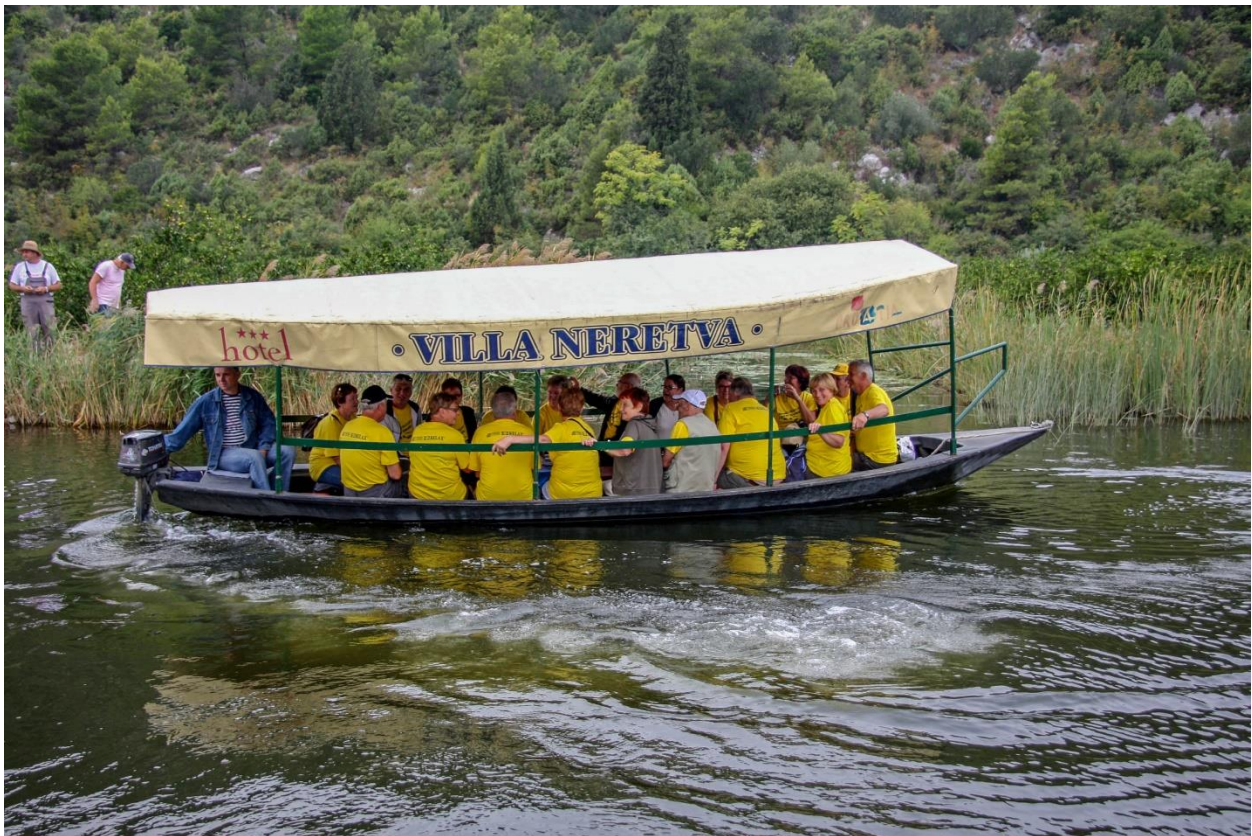
Slika 10. Safari izleti kroz Neretvu, pristup: 22.8.2023. https://www.aep-zabac.com/fotosafari/

atrakcija, u kojoj će turisti moći uživati u kulturnoj i prirodnoj baštini, rijeci Neretvi, Jadranskom moru koje je također blizu te u obilascima različitih vrsta gradova. Ruralni turizam trebao bi dosegnuti svoj maksimum te će dolina Neretve i dalje biti najpoznatija po izvozima različitih poljoprivrednih proizvoda.