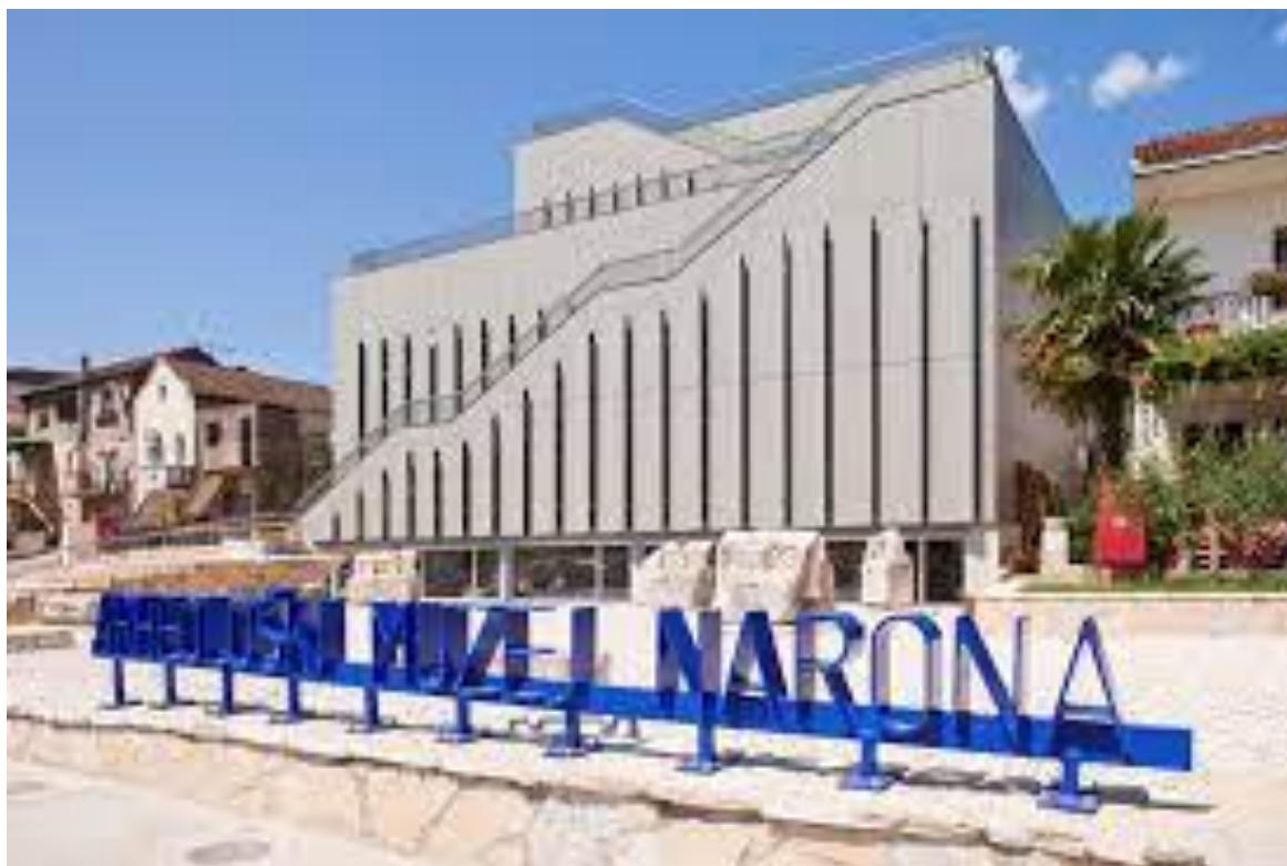
Slika 5. Arheološki muzej Naronu u mjestu Vid pored Metkovića, pristup: 10.8.2023 https://hr.wikipedia.org/wiki/Arheolo%C5%A1ki_muzej_Narona

Osim kulturno-povijesne materijalne baštine nužno je istaknuti i nematerijalnu baštinu koja se ističe brojnim kulturnim i turističkim manifestacijama. Jedna od najpoznatijih atrakcija i događaja je Maraton lađa, koji predstavlja jedno od najpoznatijih atrakcija na području Republike Hrvatske. Po brojnosti sudionika također je jedan od najvećih manifestacija na ovom području jer sudjeluje oko 35 posada, od kojih svaka broji po 18 članova. Maraton lađa amatersko je športsko natjecanje u utrci lađa, tradicijskih autohtonih plovila u dolini Neretve s dužinom rute od 22,5 km. Održava se jednom godišnje, druge subote u kolovozu, pod pokroviteljstvom hrvatskoga predsjednika, a u organizaciji Udruge lađara Neretve. Prvi maraton održan je 13. rujna 1998. godine u sklopu obilježavanja sedme obljetnice akcije Hrvatske vojske Operacija Zelena tabla - Mala bara. Može se reći da ga uživo gleda nekoliko desetaka tisuća gledatelja duž cijele rute, što uz obalu Neretve, što u turističkim i privatnim brodovima, kao i iz (za tu prigodu) posebno organiziranog vlaka. Nadalje, osim Maratona lađa, od ostalih poznatih manifestacija u dolini Neretve potrebno je istaknuti smotru folklora „Na Neretvu misečina pala“ te festival