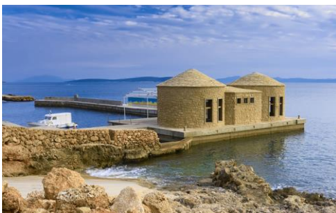
Slika 8: Bilo Idro