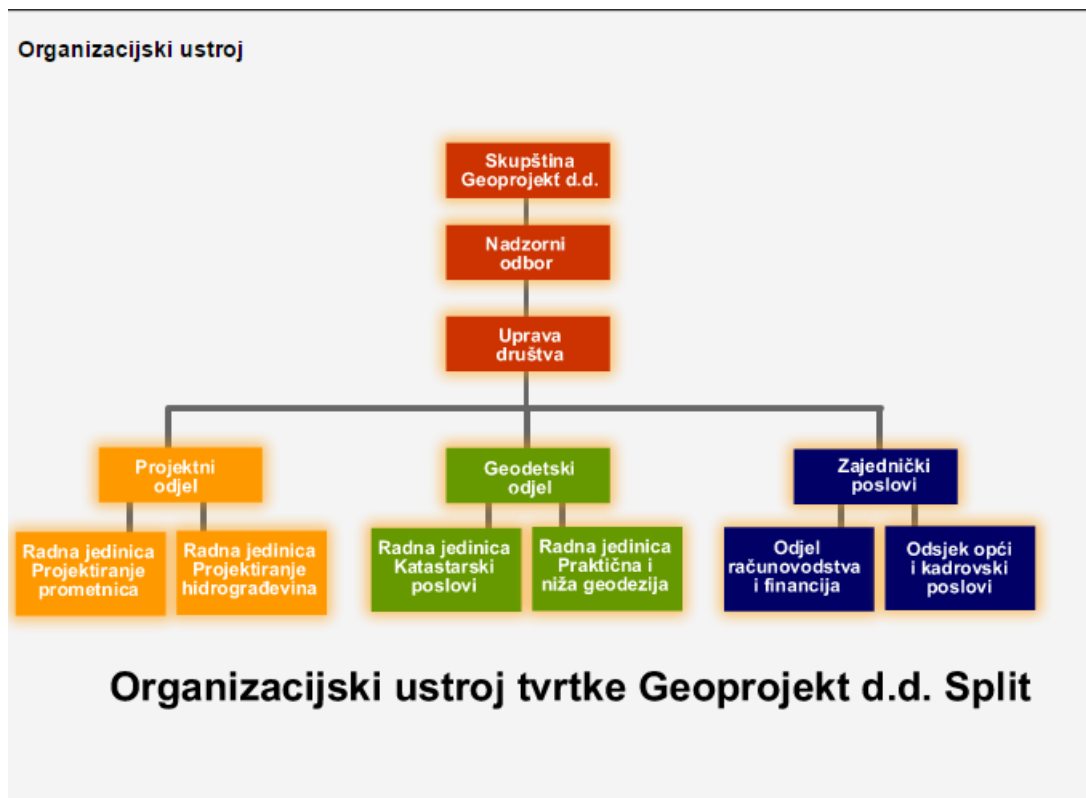
Slika 1- Organizacijski ustroj tvrtke Geoprojekt d.d.