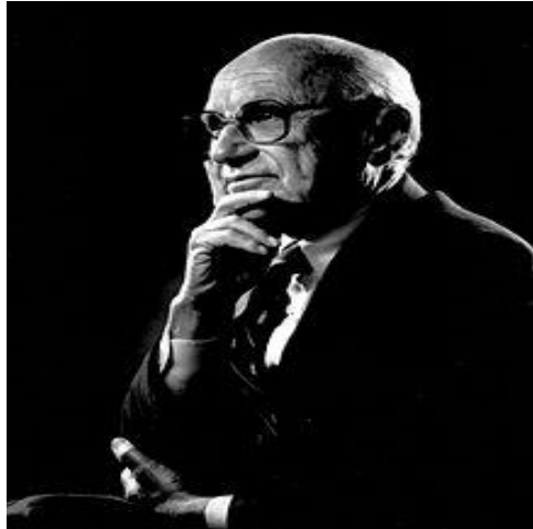
Slika 3. Milton Friedman