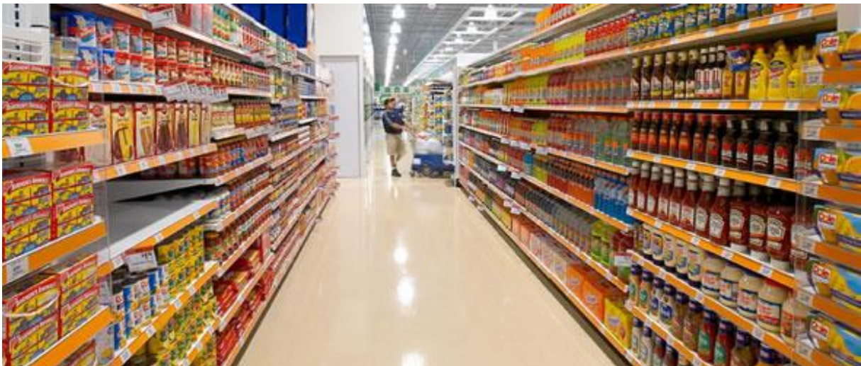
Slika 3. Maloprodaja

Maloprodaja je način prodaje putem koje se artikli/ proizvodi/ robe prodaju krajnjem kupcu, potrošaču ili korisniku. Takav način prodaje može se odvijati na fiksnim lokacijama ili online. Trgovine maloprodaje nabavu svojih artikala/ proizvoda/ robe izvršavaju tako što ih naručuju u velikim količinama od proizvođača ili od veleprodaje kako bi ih prezentirali i prodali krajnjem kupcu, potrošaču ili korisniku (Wikipedia, 2013).