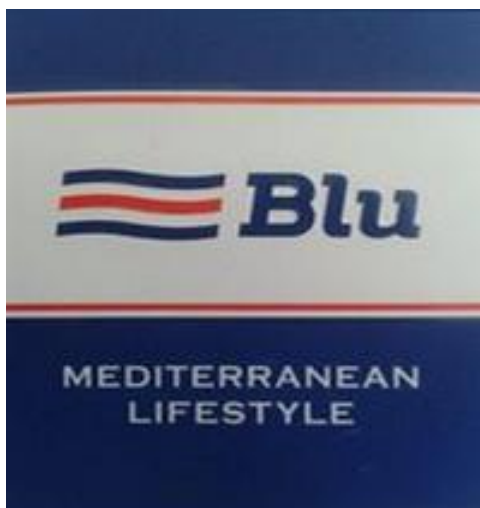
Slika 9: Logo za robnu marku Blu

Tvrtka se pozicionirala na tržište sa vlastitom robnom markom 'Blu' koja je različita od ostalih trgovina na području. To je odjeća za djecu i odrasle u mornarskom stilu (bijelo-plave-crvene boje/prugaste teme). Pokazalo se učinkovitim potezom jer je prodaja u samom vrhu. Veliki interes pokazuju kako domaći tako i strani kupci koji često daju pozitivne komentare na sam izgled trgovine i odjeće.