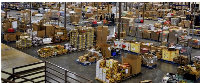
Slika 1. Veleprodajno skladište

Za veleprodaju je karakterističan mali broj kupaca, a kod maloprodaje se susrećemo sa velikim brojem kupaca.