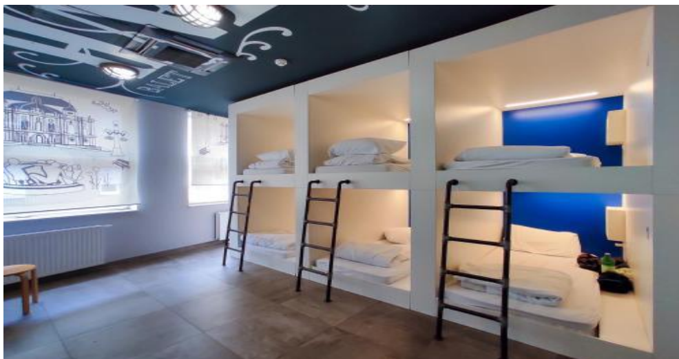
Slika 9. Primjer modernog hostela u Zagrebu