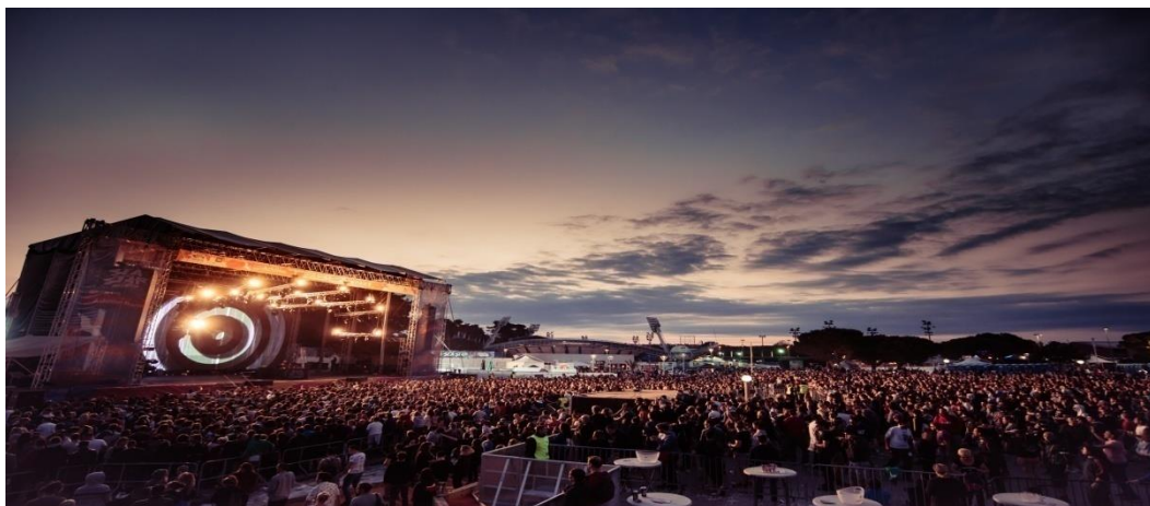
Slika 4. Sea Star festival u Umagu