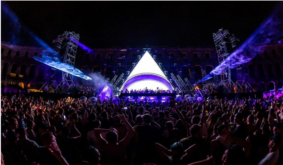
Slika 8. Pula Music Week

zahvaljujući brojnim glazbenim manifestacijama, u agenciji imaju porast dolazaka mladih gostiju u dobi između 18 i 34 godina za čak 70 % u odnosu na prethodnu godinu.