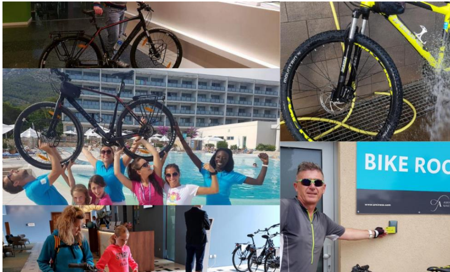
Slika 7. Cikloturizam u Hrvatskoj