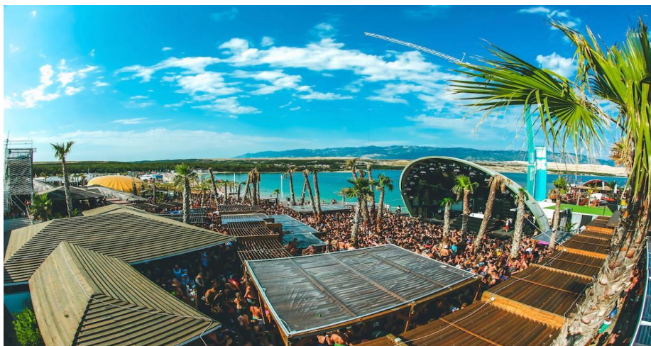
Slika 5. Novalja - plaža Zrće