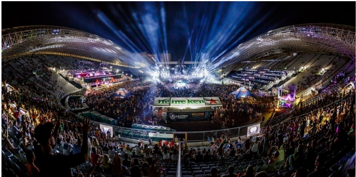
Slika 3. Ultra Europe Music festival Split

U Hrvatskoj je zasigurno jedan od najdominantnijih oblika omladinskog turizma – zabavni (eng. party ) turizam. Zbog poznatih glazbenih festivala diljem Jadrana kao što je pulski Outlook ili Dimensions , splitska Ultra , šibenski Terrane ili zagrebački InMusic , Hrvatska se visoko pozicionirala kao zabavna destinacija koja privlači mlade turiste.