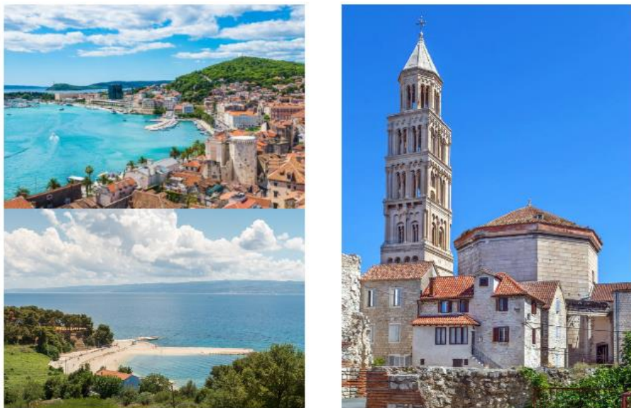
Slika 1 - Prikaz lokacije i pogleda Hotela Pax u Splitu

Predmetno istraživanje provodi se na primjeru Hotela Pax u komunikaciji sa njegovim stručnim osobljem kako je navedeno i prethodno u ovome radu. Hotel Pax je hotel koji se nalazi u Splitu, a za viziju ima: „biti drugi dom zadovoljnim gostima koji se iznova vraćaju u naš hotel.“ Na službenim stranicama hotela vizija je jasno istaknuta i ako se osvrnemo na recenzije predmetnoga hotela, može se reći kako to gosti jako cijene. Obzirom na viziju hotela ovaj hotel bio je izvrsan primjer za provesti istraživanje sa naglaskom na direktnu prodaju obzirom da je i sami kao takvu i poziču. Hotel pruža opuštajući odmor u Classic i Superior sobama uz bogati doručak, besplatan parking i korištenje fitnessa. Recepcija otvorena je 0-24h, a uslužno osoblje je uvijek spremno pomoći savjetom i toplim osmijehom. Hotel Pax se nalazi u idealnom dijelu grada Splita – tik do povijesne jezgre Splita, a opet izdvojen od gradske vreve. Hotel Pax udaljen je svega 250m od plaže Trstenik, i samo 2 km od povijesne jezgre grada.