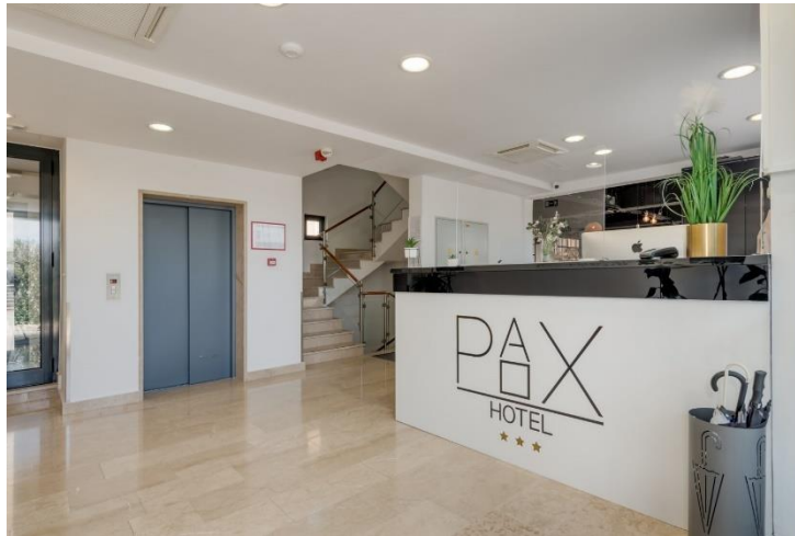
Slika 2 - Prijemni odjel Hotela Pax

izazov opstati na tržištu tijekom cijele godine, no oni to uspješno čine kroz pomno odabrane strategije i konkurentnost na tržištu.