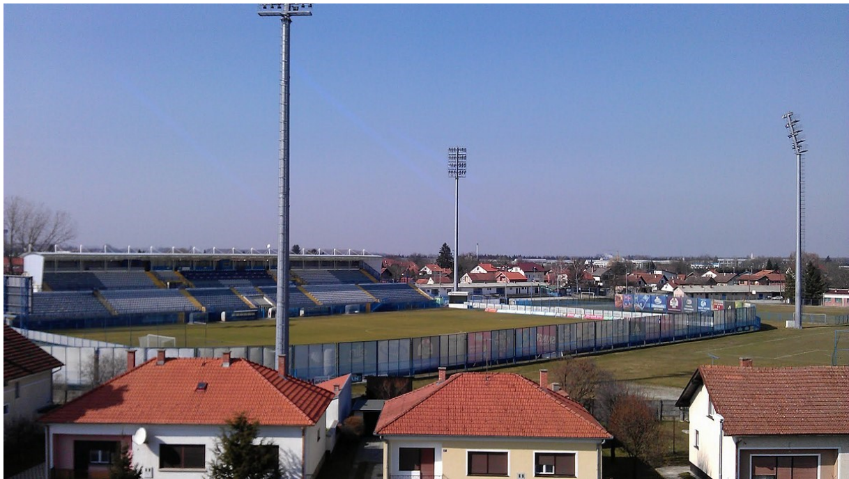
Slika 8: Gradski stadion Ivan Kušek Apaš, Koprivnica

Prema Transfermarktu njihova momčad vrijedi 8.30 milijuna eura zbog čega su treća najjeftinija momčad lige. S obzirom da su im igra i rezultati ispodprosječni u posljednjih deset godina, klub nema popularne igrače te nije imao značajne izlazne transfere. Ono što ovaj klub izdvaja od ostalih, ne samo u Hrvatskoj nego i u Europi, su Podravske štuke. Riječ je o najmlađoj navijačkoj skupini u Hrvatskoj koja se oformila prošle sezone. Ovi navijači su redom mala djeca koja idu u osnovnu školu i navijaju za Slaven Belupo, a od rekvizita imaju megafon, zastave, bubnjeve i transparente te su nesvakidašnja pojava u svijetu nogometa.