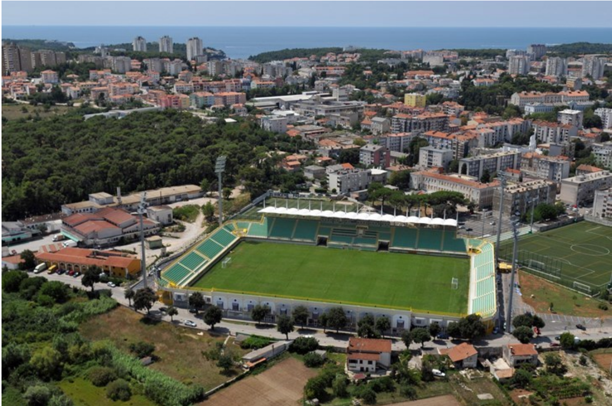
Slika 7: Stadion Aldo Drosina, Pula

Što se tiče navijanja, ultras grupa „Demoni“ se nalazi na sjevernoj tribini svih domaćih utakmica te povremeno bude i na gostovanjima. Među manjim ultras grupama su u Hrvatskoj te su usporedivi s „Kohortom“, koji su navijači NK Osijeka.