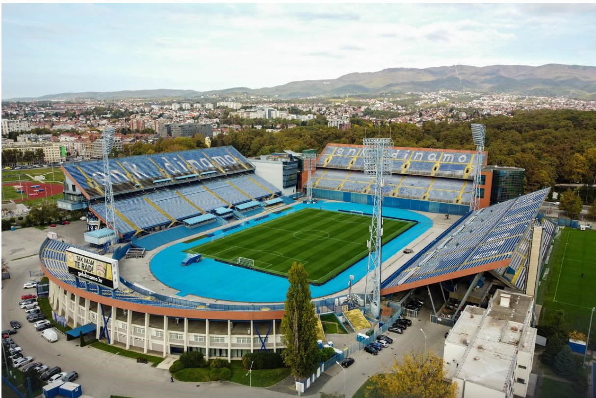
Slika 5: Stadion Maksimir, Zagreb

Iako do sada nisu kreirali marketing oko specifičnog igrača, Dinamo je u travnju napravio kampanju u kojoj želi vratiti Luku Modrića u Dinamo što bi bio najveći transfer u povijesti kluba. Dinamo je otkupio prostor u najpopularnijim španjolskim sportskim novinama Marca te su preko cijele jedne stranice postavili plavi dres Dinama s brojem 10 i natpisom Modrić. Sve je popratilo i natpis #ImaloBiSmisla koji se proširio i društvenim mrežama. Prema cjeniku Marce, Dinamo je u ovu kampanju uložio barem 60 tisuća eura, a potencijalni dolazak Modrića bi značajno povećao zanimanje za Dinamom i HNL-om u inozemstvu.