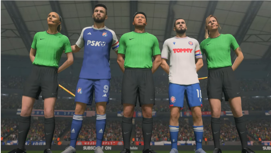
Slika 11: Hajduk i Dinamo u „EA FC 24“ videoigri