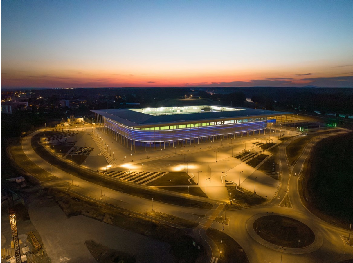
Slika 3: Opus Arena, Osijek