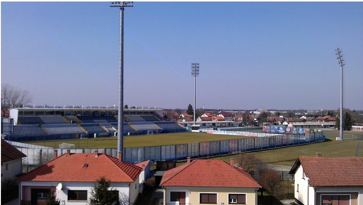
Slika 8: Gradski stadion Ivan Kušek Apaš, Koprivnica

Prema Transfermarktu njihova momčad vrijedi 8.30 milijuna eura zbog čega su treća najjeftinija momčad lige. S obzirom da su im igra i rezultati ispodprosječni u posljednjih deset godina, klub nema popularne igrače te nije imao značajne izlazne transfere. Ono što ovaj klub izdvaja od ostalih, ne samo u Hrvatskoj nego i u Europi, su Podravske štuke. Riječ je o najmlađoj navijačkoj skupini u Hrvatskoj koja se oformila prošle sezone. Ovi navijači su redom mala djeca koja idu u osnovnu školu i navijaju za Slaven Belupo, a od rekvizita imaju megafon, zastave, bubnjeve i transparente te su nesvakidašnja pojava u svijetu nogometa.