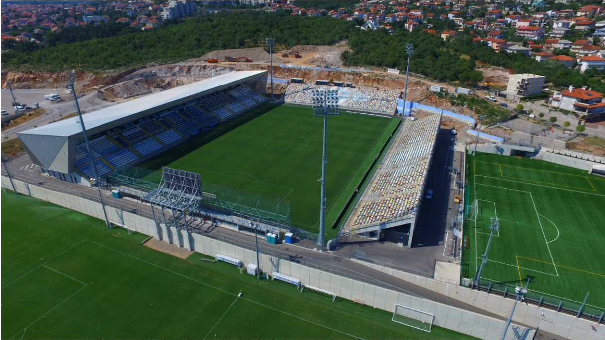
Slika 6: Stadion Rujevica, Rijeka