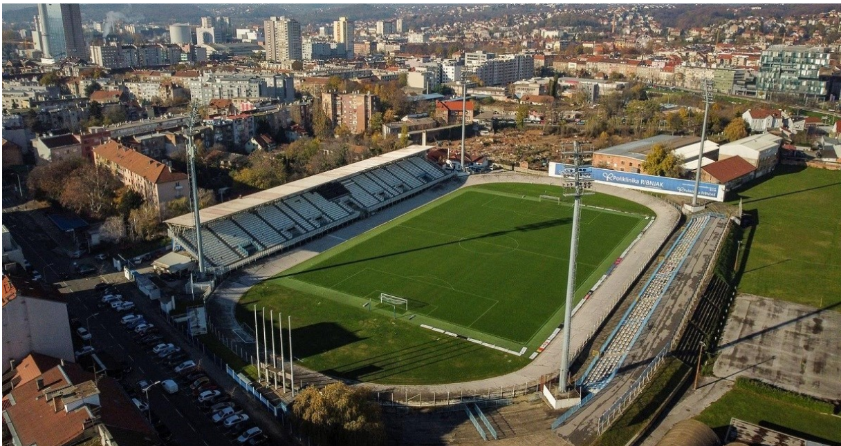
Slika 11: Stadion Kranjčevićeva, Zagreb

Momčad Lokomotive prema Transfermarktu vrijedi 11.78 milijuna eura što je šesta najskuplja momčad prvenstva. Ono što izdvaja Lokomotivu od ostatka HNL-a je činjenica da imaju najmlađu ekipu. Uz iznimku nekoliko starijih igrača koji su u jednom trenutku svoje karijere imali i nastupe za reprezentaciju Hrvatske (Marin Leovac, Duje Čop, Karlo Bartolec), značajan dio momčadi čine mladi igrači s respektabilnim potencijalom. Lokomotiva je izgradila reputaciju kao klub koji promovira mlade igrače koji često naprave respektabilne karijere. Za klub su u ranoj fazi svoje karijere igrali hrvatski reprezentativci Marko Pjaca, Ante Budimir (koji je jedan od najboljih strijelac u španjolskoj ligi ove sezone), Marcelo Brozović, Lovro Majer, Luka Ivanušec itd. Klub i ove sezone ima igrače koji bi mogli imati respektabilne karijere, a oni su redom Nikola Čavlina, Martin Šotićek i Fabijan Krivak.