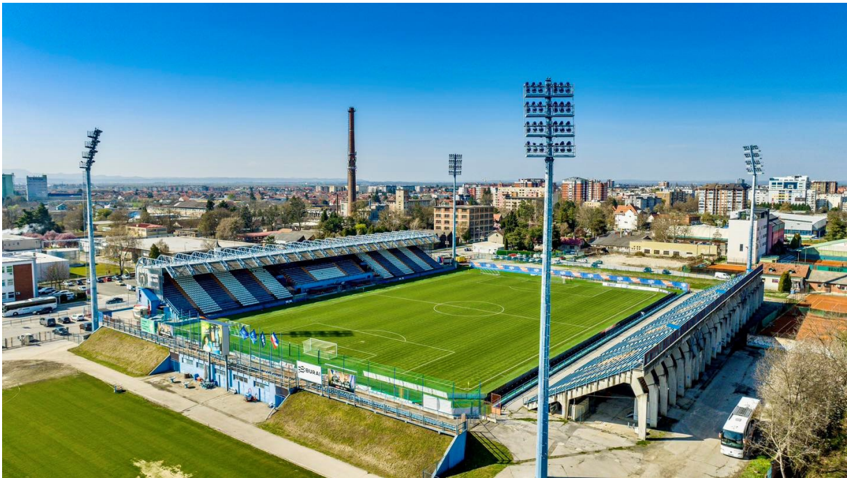
Slika 10: Stadion Varteks, Varaždin

Nakon Rudeša, Varaždin po Transfermarktu ima najjeftiniju ekipu lige koja vrijedi 8.23 milijuna eura. Klub je prošle sezone ušao u HNL te su na pogon mladih igrača zauzeli respektabilnu šestu poziciju na tablici. Nositelji te momčadi su bili Fran Brodić, Tonio Teklić, Jorgon Pellumbi i Agon Elezi, ali klub ih je sve prodao i trenutno ima osjetno lošiju momčad nego je to bio slučaj prošle sezone.