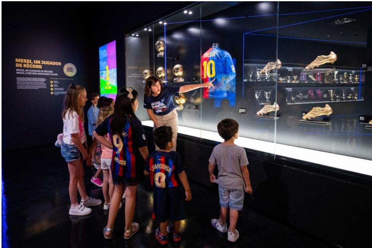
Slika 1: Muzej FC Barcelone

svoj stadion Santiago Bernabéu inozemnim turistima, a stadion se kao atrakcija predstavlja i na međunarodnim turističkim sajmovima ( Tobar, 2023)