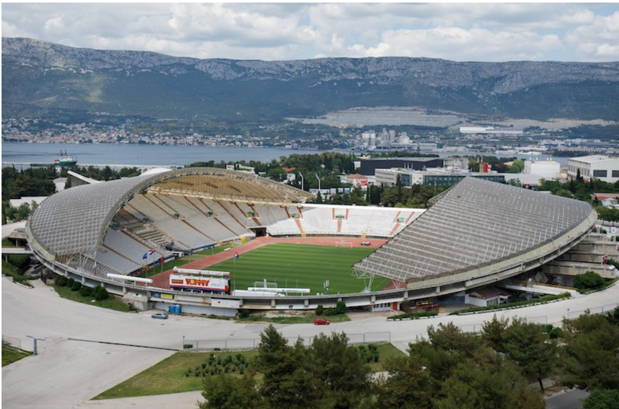
Slika 4: Stadion Poljud, Split

Što se tiče igračkog kadra, Hajduk po Transfermarktu ima drugu najskuplju momčad lige te je klub koji najbolje promovira svoje igrače kao marke koje su vezane uz klub. Klub prodaje majice s likom Marka Livaja koji je u prethodne dvije sezone bio najbolji strijelac lige te jedan od najpopularnijih igrača u Hrvatskoj. Livaja je također drugi najskuplji igrač lige, a osim njega su u Hajduku Nikola Kalinić i Ivan Perišić koji su imali velike inozemne karijere. Perišić je ovu zimu došao na posudbu u klub te je najpoznatiji igrač lige. On i Livaja su na posljednjem Svjetskom prvenstvu bili strijelci za Hrvatsku reprezentaciju koja je na posljednja dva Svjetska prvenstva bila druga i treća i tako stekla svjetsku popularnost i prepoznatljivost.