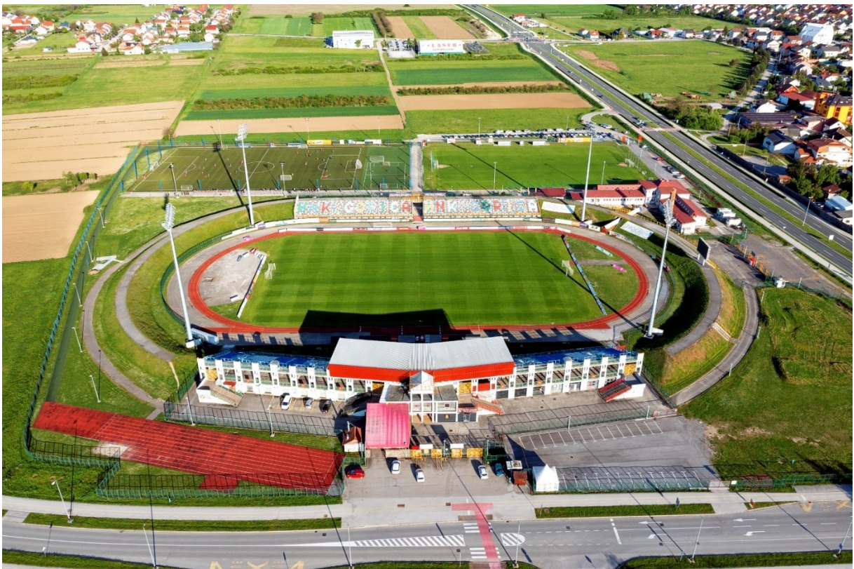
Slika 9: Gradski stadion Velika Gorica, Velika Gorica

Prema Transfermarktu momčad Gorice vrijedi 11.95 milijuna eura po čemu su peta najskuplja momčad u prvenstvu. Nemaju igrače koji su atraktivni široj javnosti, a do sada im je većina najvećih izlaznih transfera bila prema većim klubovima u Hrvatskoj gdje se ti igrači ne bi nametnuli kao ključni igrači. Jedina zanimljivost vezana uz klub je malena skupina navijača imena „Good Boys“. Prisutni su na svim domaćim utakmicama te respektabilnom broju gostujućih, a grupa je većinom satkana od roditelja i djece koji nemaju veze s ultras pokretom.