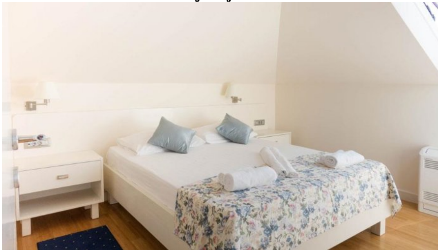
Slika 8. Smještaj Hotela Pleter

Hotel raspolaže sa dva apartmana i 33 sobe koje pružaju nevjerojatan pogled na more, valove, brodice, a to je tako očaravajuće da koji pruža osjećaj kao da je more u sobi. Sobe okrenute prema planini, pružaju apsolutan mir i relaksaciju. Sobe su moderno uređene u bijelo i sadrže: LCD televizor sa satelitskim programima i radiom, klimu, telefon, internet priključak, radni stol, mini bar, kupaonicu s kadom ili tuš kabinom, sušilo za kosu i toaletne potrepštine, a na raspolaganju su fitness i sauna.