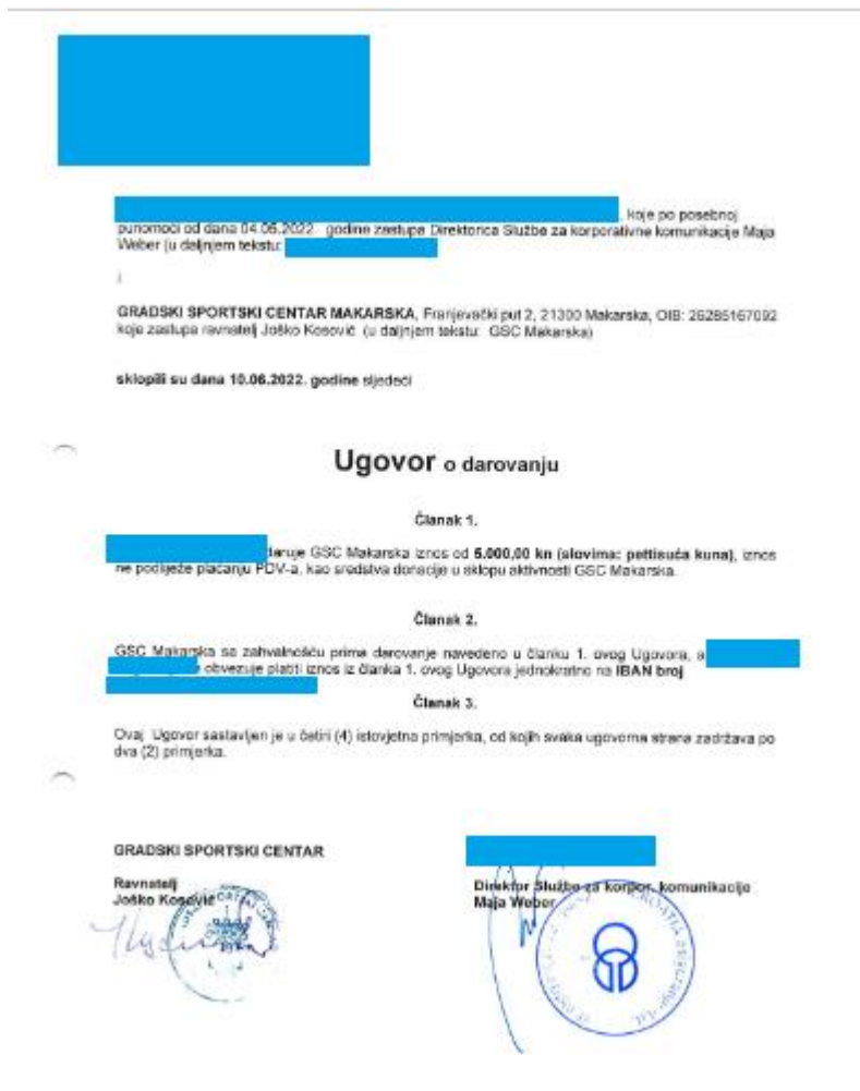
Grafički prikaz 6. Donacija GSC-u Makarska iz 2022. godine

osiguravajućim društvom, dok Grafički prikaz 7. prikazuje knjiženje iste te donacije. Stavke su prikazane u kunama jer je u 2022. godini službena valuta u RH bila još uvijek kuna.