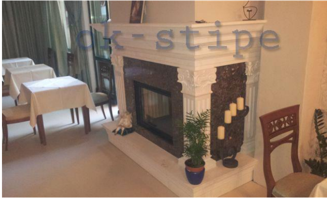
Slika 8: Kamin