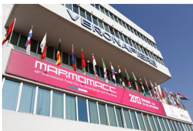
Slika 2: Ulaz na sajam MARMOMACC

Na sajmu u Veroni izlagači iz Hrvatske često dobivaju prezentacije unutar službenih događanja na sajmu. Najzapaženiji uspjeh naši izlagači imali su 2012. godine kada je u sklopu sajma održana prezentacija projekta „Kamen“. Projekt je osim izlagača iz Hrvatske okupio i izlagače iz Bosne i Hercegovine, kao zajednički projekt potpomognut sredstvima IPA programa prekogranične suradnje iz EU fondova. Cilj projekta bio je doprinos razvoju prekograničnog gospodarstva na području Dalmacije i Hercegovine, a sve kroz razvoj gospodarstva u sektoru eksploatacije i obrade kamena. Kroz ovaj projekt popularizirala se obrada kamena i tradicionalno kamenoklesarstvo, kao profitabilna grana gospodarstva, jačanje suradnje kod poduzetnika, a sve s ciljem rasta i bolje konkurentnosti na tržištu. Jedan od specifičnosti projekta je unapređenje kapaciteta i poboljšanje dostupnosti usluga na cijelom području.