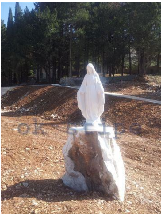
Slika 7 : Gospa