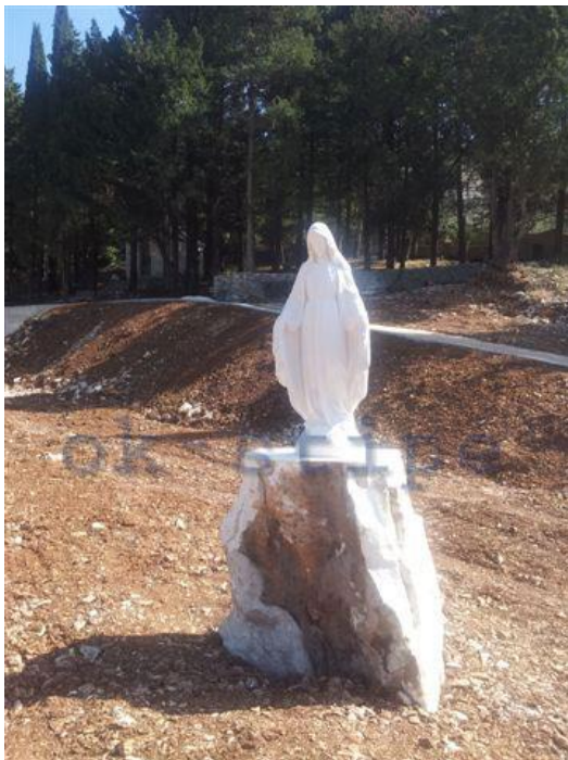
Slika 7 : Gospa