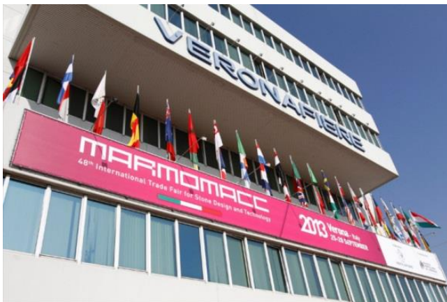
Slika 2: Ulaz na sajam MARMOMACC

Na sajmu u Veroni izlagači iz Hrvatske često dobivaju prezentacije unutar službenih događanja na sajmu. Najzapaženiji uspjeh naši izlagači imali su 2012. godine kada je u sklopu sajma održana prezentacija projekta „Kamen“. Projekt je osim izlagača iz Hrvatske okupio i izlagače iz Bosne i Hercegovine, kao zajednički projekt potpomognut sredstvima IPA programa prekogranične suradnje iz EU fondova. Cilj projekta bio je doprinos razvoju prekograničnog gospodarstva na području Dalmacije i Hercegovine, a sve kroz razvoj gospodarstva u sektoru eksploatacije i obrade kamena. Kroz ovaj projekt popularizirala se obrada kamena i tradicionalno kamenoklesarstvo, kao profitabilna grana gospodarstva, jačanje suradnje kod poduzetnika, a sve s ciljem rasta i bolje konkurentnosti na tržištu. Jedan od specifičnosti projekta je unapređenje kapaciteta i poboljšanje dostupnosti usluga na cijelom području.