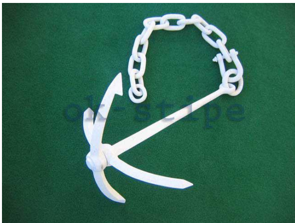
Slika 9: Sidro