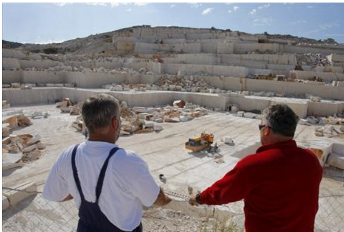
Slika 5: Kamenolom Maslinica u Pučišćima

Radovi ovog obrta i njegovih vrijednih radnika krase objekte, kako u zemlji, tako i u inozemstvu; za svoj rad dobitnici su mnogih nagrada.