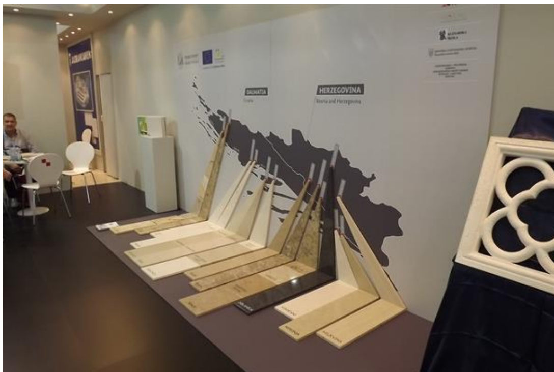
Slika 14 : Projekt kamena na sajmu MARMOMACC 2012.godine