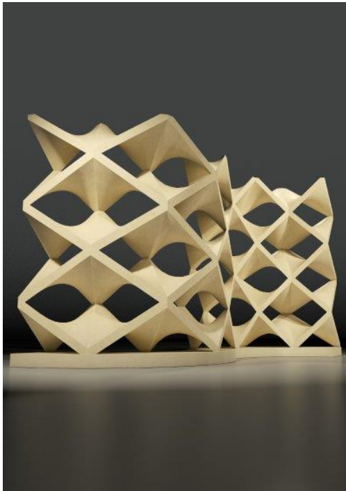
Slika 4: Dizajn na sajmu MARMOMACC