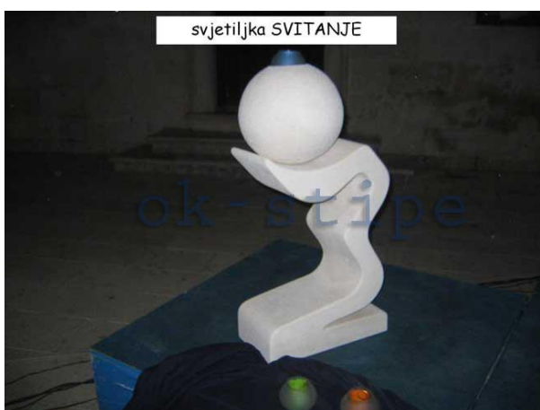
Slika 10: Svjetiljka Svitanje