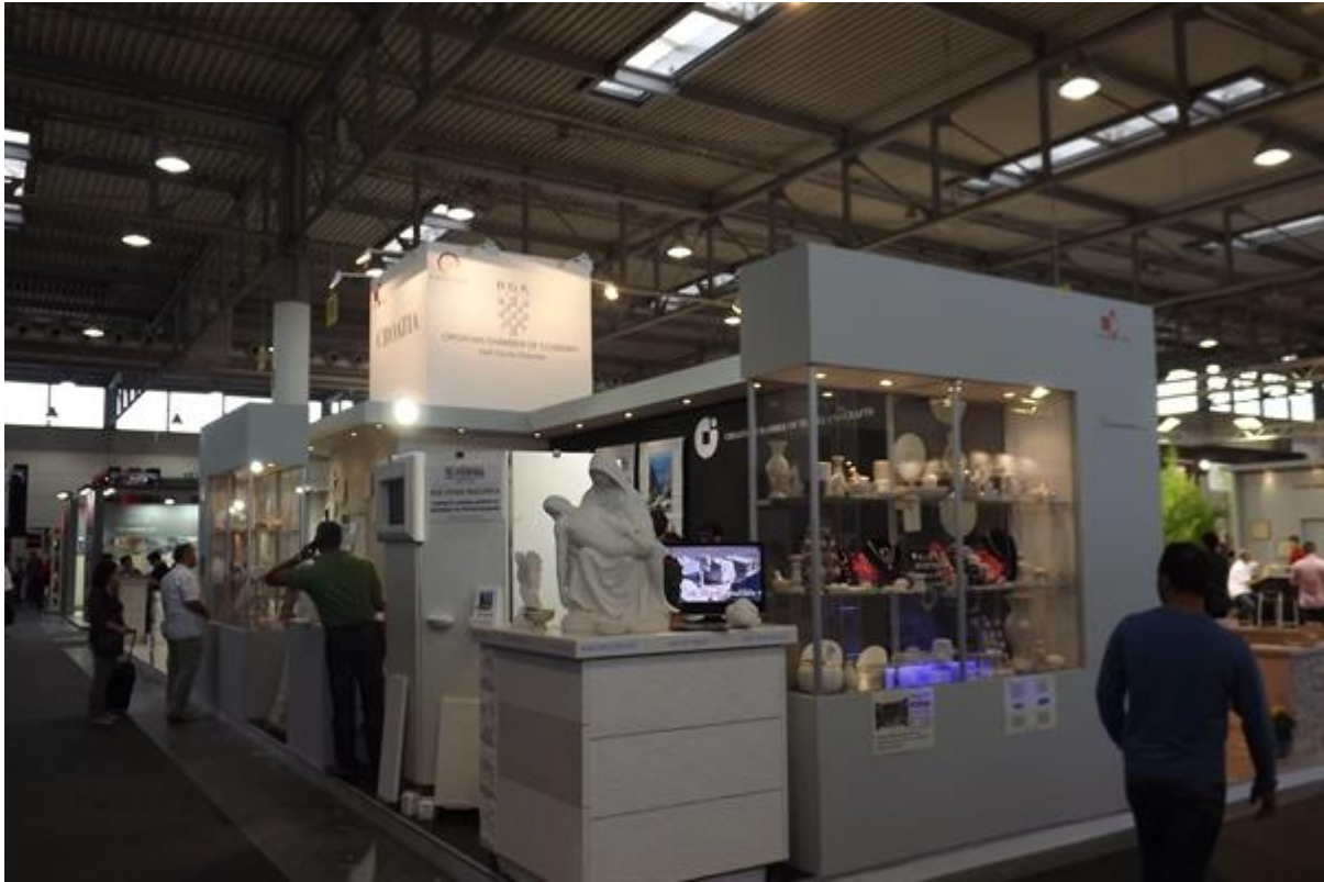
Slika 13 : Štanda na sajmu MARMOMACC 2012.godine