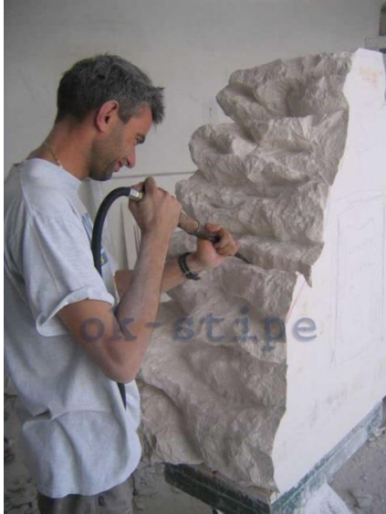
Slika 12: Obrada kamena

Tijekom renesanse i baroka u kamenolomima pokraj Pučišća obrazovale su se čitave dinastije poznatih hrvatskih klesara među kojima se posebno ističu Juraj Dalmatinac, Andrija Aleši i Nikola Firentinac.