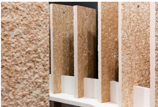
Slika 3: Kameni proizvodi na sajmu MARMOMACC