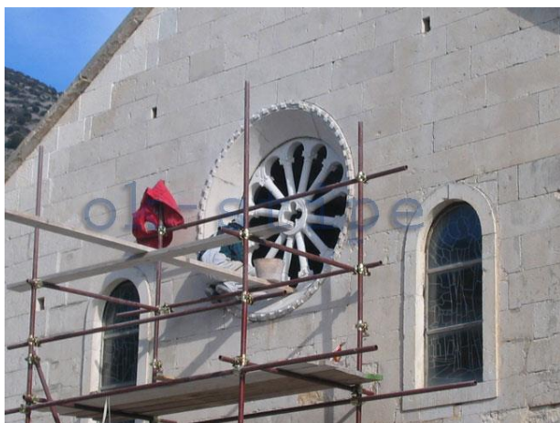
Slika 11: Restauratorski radovi