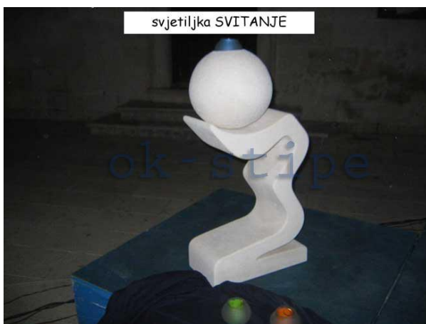
Slika 10: Svjetiljka Svitanje