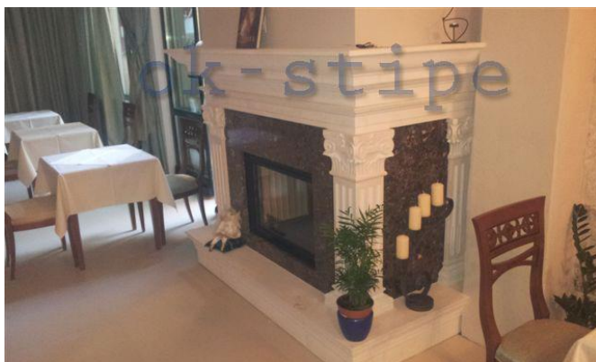
Slika 8: Kamin