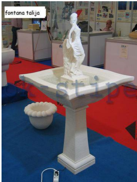
Slika 6: Fontana Talija