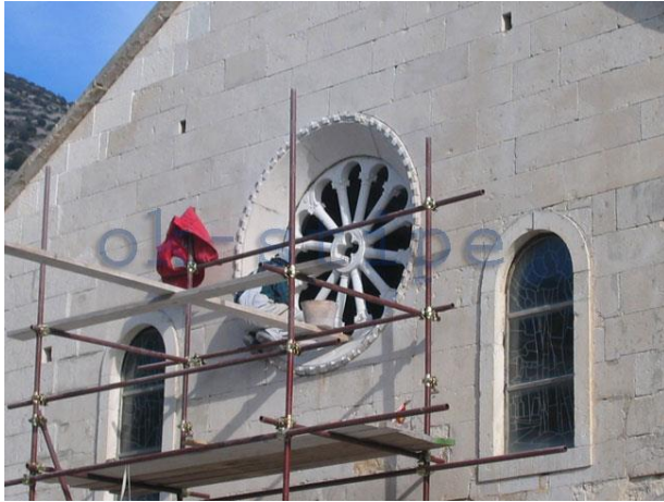
Slika 11: Restauratorski radovi