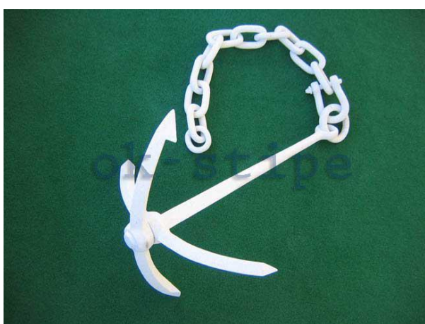
Slika 9: Sidro