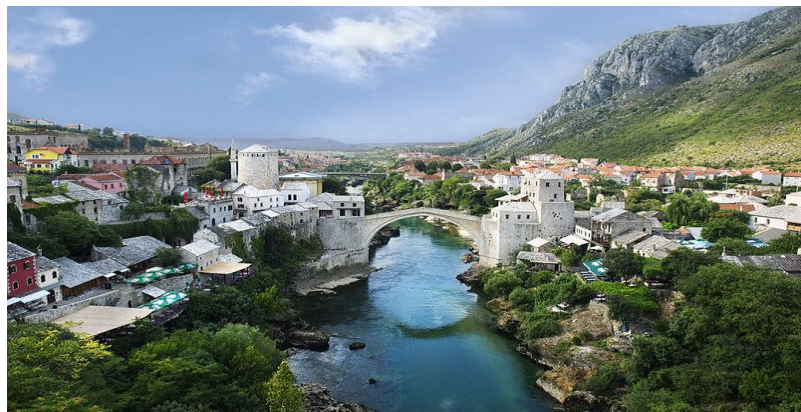
Slika 12: Stari most u Mostaru