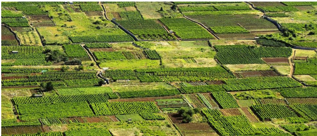
Slika 3: Starogradsko polje na otoku Hvaru