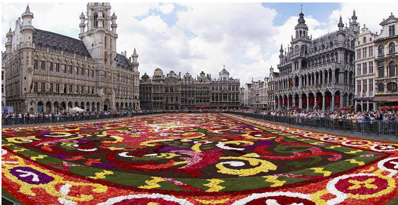
Slika 11: Veliki trg u Brusselu