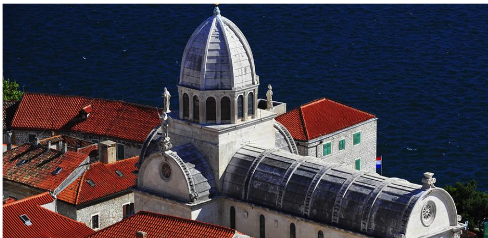
Slika 5: Katedrala Sv. Jakova u Šibeniku