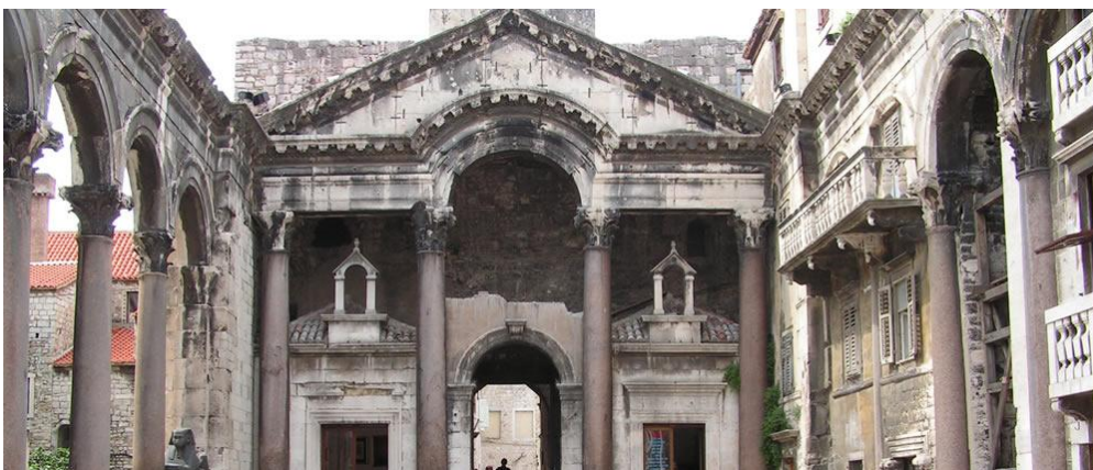
Slika 2: Dioklecijanova palača u Splitu