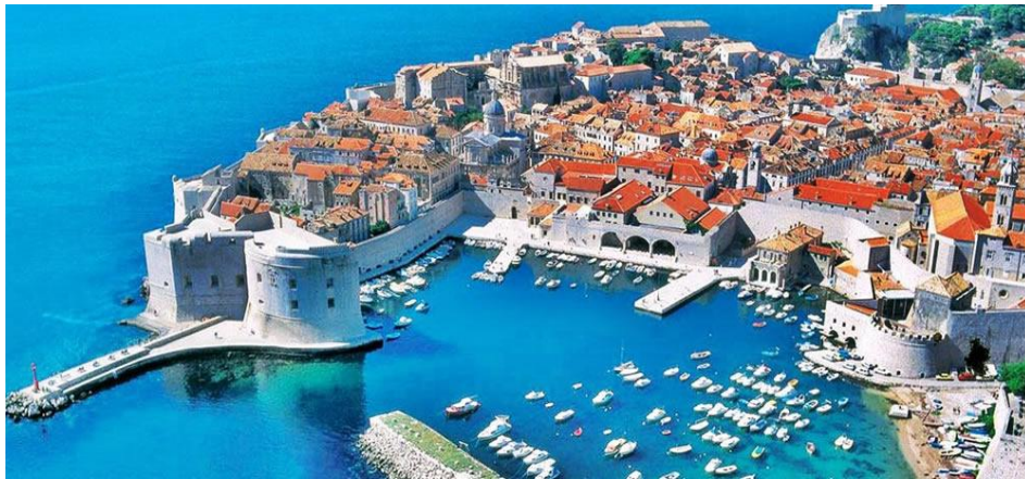
Slika 4: Stari grad Dubrovnik