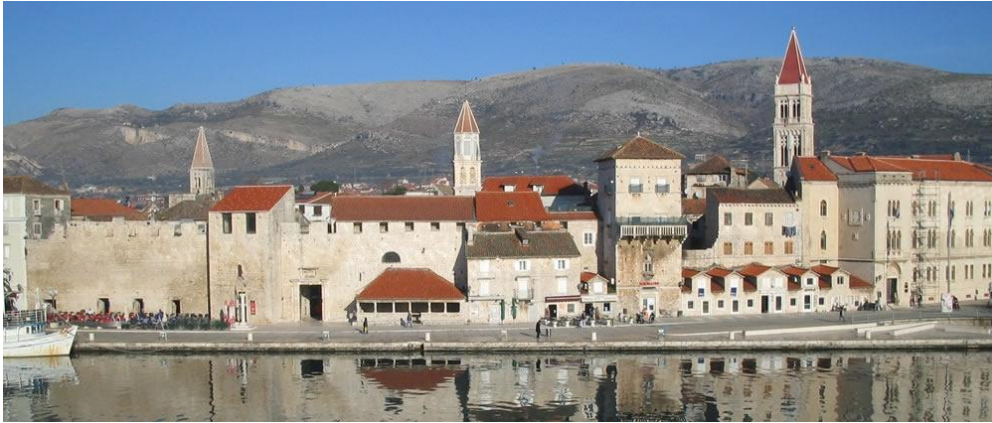
Slika 1: Povijesna jezgra Trogira