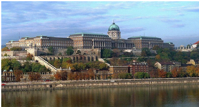
Slika 14: Budimski dvorac u Mađarskoj