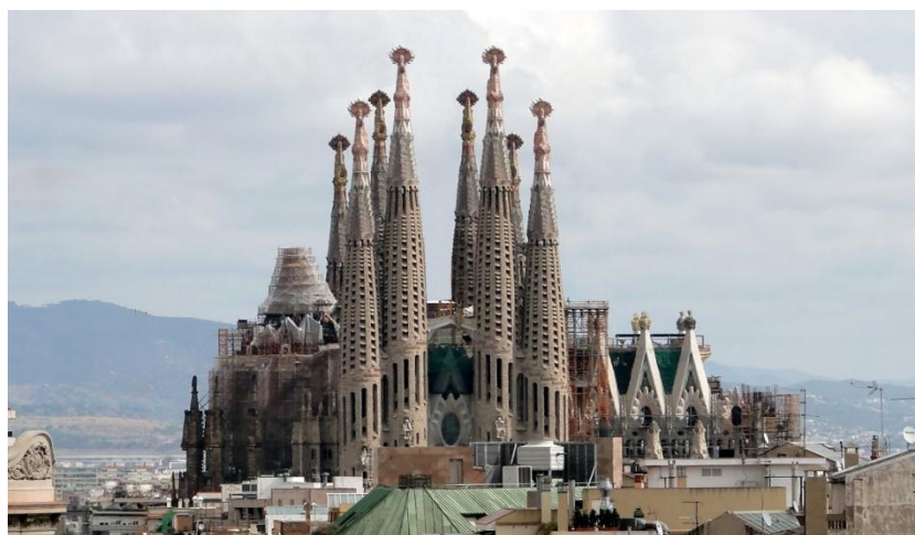
Slika 15: Djela Antonija Gaudija: Sagrada Familia, Barcelona u Španjolskoj