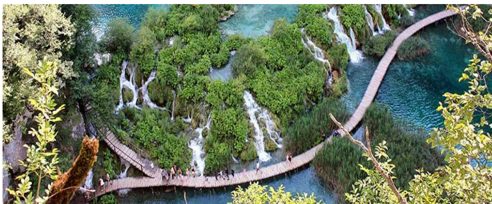
Slika 6: Nacionalni park Plitvička jezera