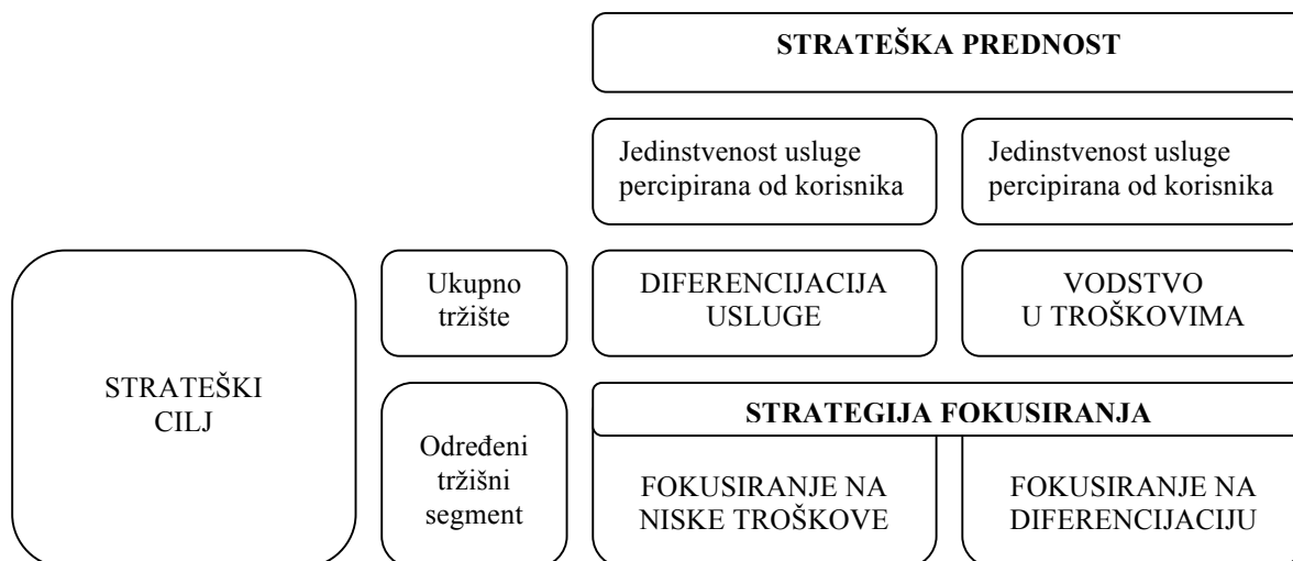
Slika 1: Tri generičke konkurentske strategije u upravljanju uslugama