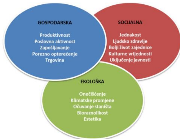
Slika 2 : Ciljevi održivosti

Ukratko, navedene intervencije možemo svrstati u tri skupine, a to su gospodarska, socijalna te ekonomska skupina 13 . Jednaka važnost svake pojedine skupine sa svojim dijelovima prikazana je na slici 2.