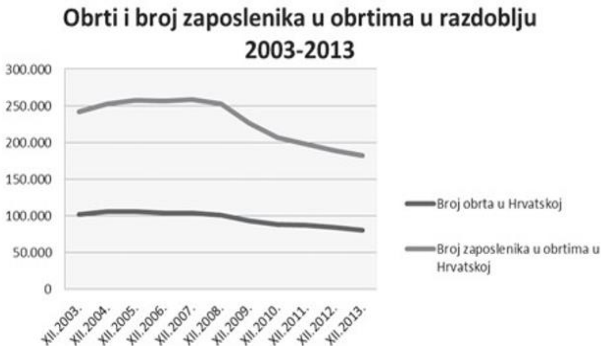
Slika 1. Obrti i broj zaposlenika u obrtima od 2003. do 2013. godine.

Izvor: Ukić, Lj., Martić Kuran, L. (2015.), Uloga i značaj malih i srednjih poduzetnika na ruralnim područjima Dalmatinske Zagore, Zbornik radova Veleučilišta u Šibeniku (1-2): 221-229.