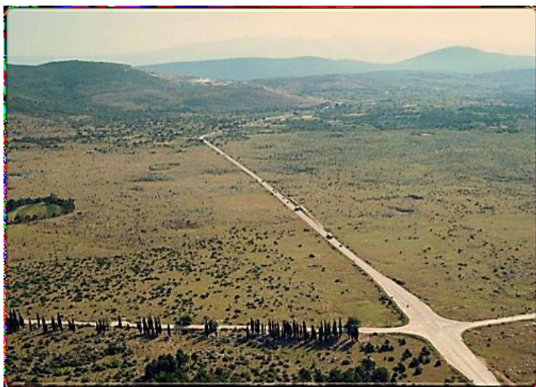
SLIKA 1: Dugopolje prije osnutka poduzetničke zone

Osnovana je Odlukom o donošenju Plana uređenja područja Dugopolje – Podi od strane Općinskog vijeća Općine Dugopolje na sjednici održanoj 18. rujna 1997.god. Godinu dana nakon, 28. Rujna 1998. na blagdan općinskog zaštitnika položen je kamen temeljac.