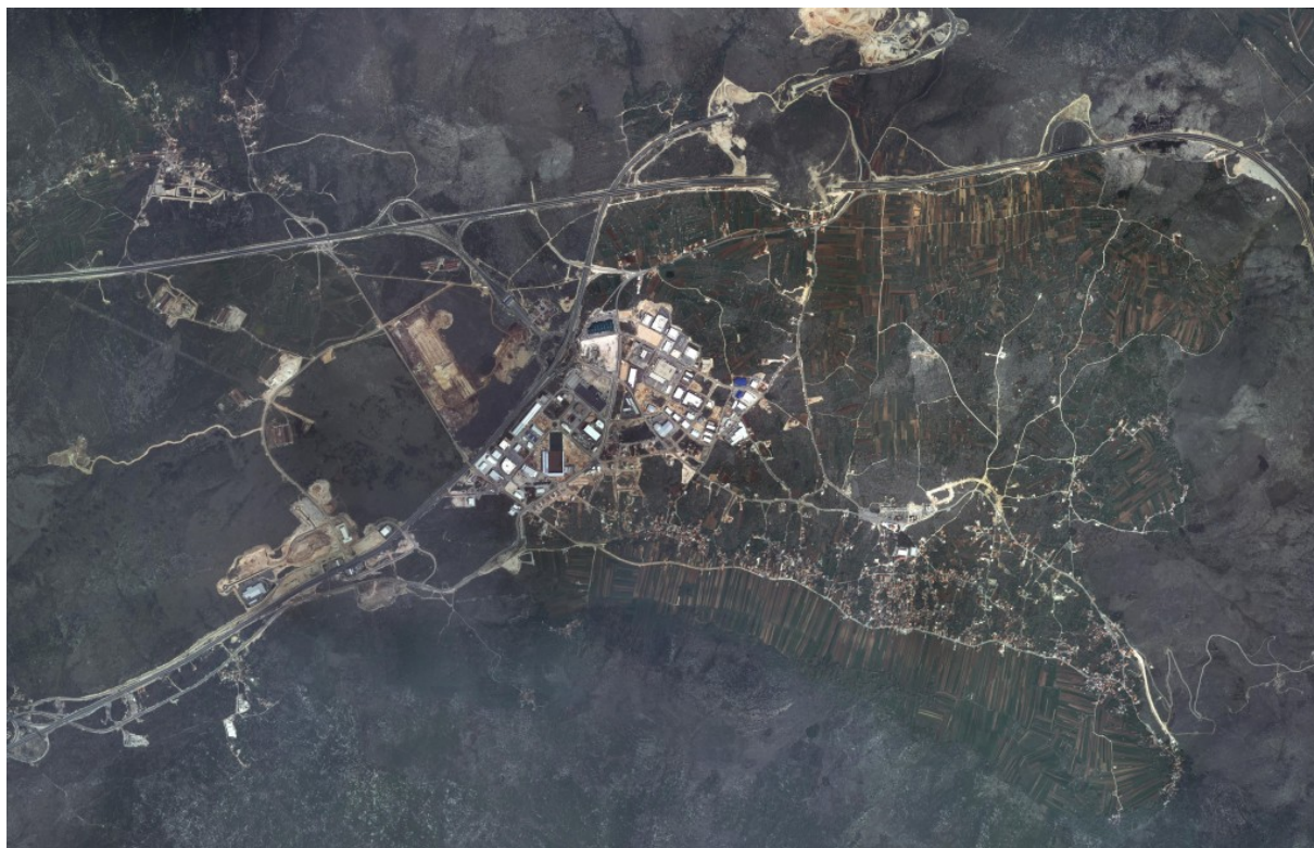
SLIKA 3: Shematski prikaz zone

Rekreacijski dio zone „Podi“ dozvoljava izgradnju prostora za igru najmlađim uzrastima te za sve one stanovnike koje zelenilo koristi za rekreaciju i zdravi život. Moguća je i izgradnja biciklističke staze, boćališta i sličnih sadržaja. Na zapadnom djelu analizirane zone je postojeća gustirna pa tu nije dozvoljena gradnja, osim rekonstrukcije.