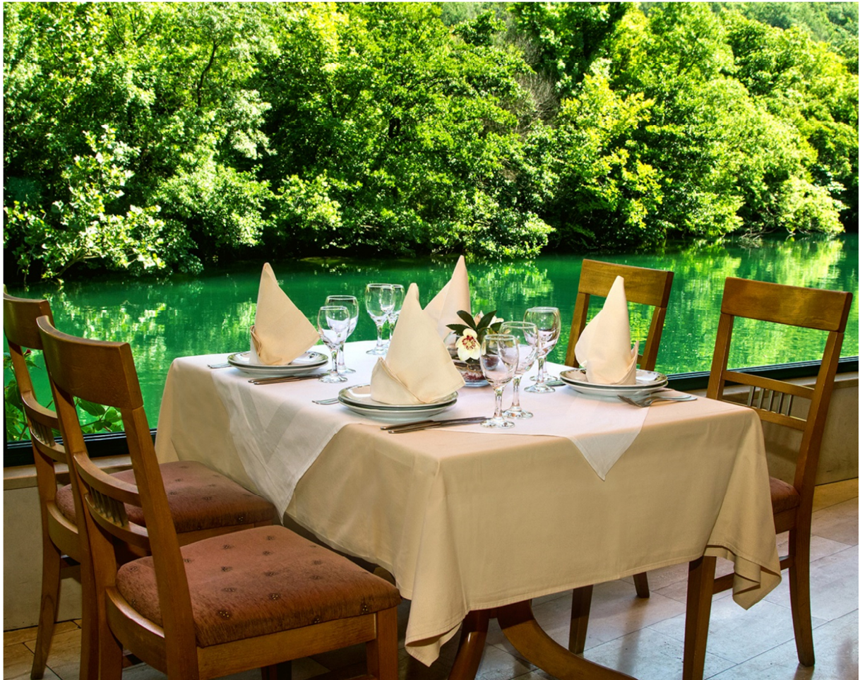
Slika 3. Restoran Kaštil Slanica