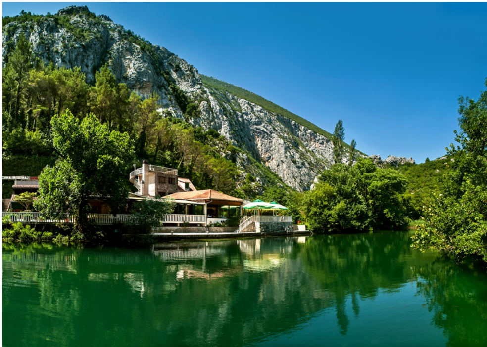
Slika 2. Restoran Kaštil Slanica

Poduzeće Kaštil Slanica posluje kao obrt za ugostiteljstvo, turizam i trgovinu i usluge. Osnovan je 1996. godine te je u svom sastavu imao samo restoran Kaštil Slanicu. 2001. godine, poduzeće Kaštil Slanica širi svoje poslovanje u ugostiteljstvu te otvara restoran – izletišta Radmanove mlinice u sklopu kojeg je i pansion Radmanove mlinice. Rastom broja posjetitelja, pokazala se potreba za pružanjem dodatnih usluga i sadržaja te je 2006. godine osnovana turistička agencija Radmanove mlinice s ciljem poticanja prepoznatljivosti kanjona Cetine kao destinacije za eno gastro doživljaje i aktivni odmor. Obrt kontinuirano posluje s dobiti, a u skladu s tim raste broj zaposlenih na 55, od čega je 15 stalno zaposlenih.