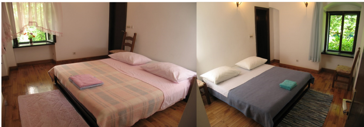
Slika 6. Sobe u pansionu Radmanove mlinice

Pansion Radmanove mlinice se nalazi u sklopu restoran – izletišta Radmanove mlinice te nudi smještaj na bazi noćenja s doručkom, polupansiona ili punog pansiona u klimatiziranim, dvokrevetnim sobama s kupaonicom opremljenom tuš kabinom i fenom. Pansion raspolaže s 4 dvokrevetne i 1 trokrevetnom sobom.