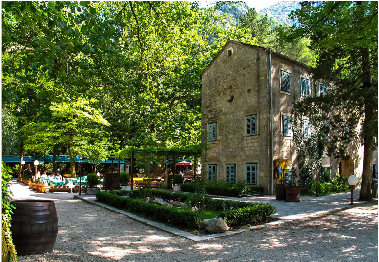
Slika 4. Restoran – izletište Radmanove mlinice