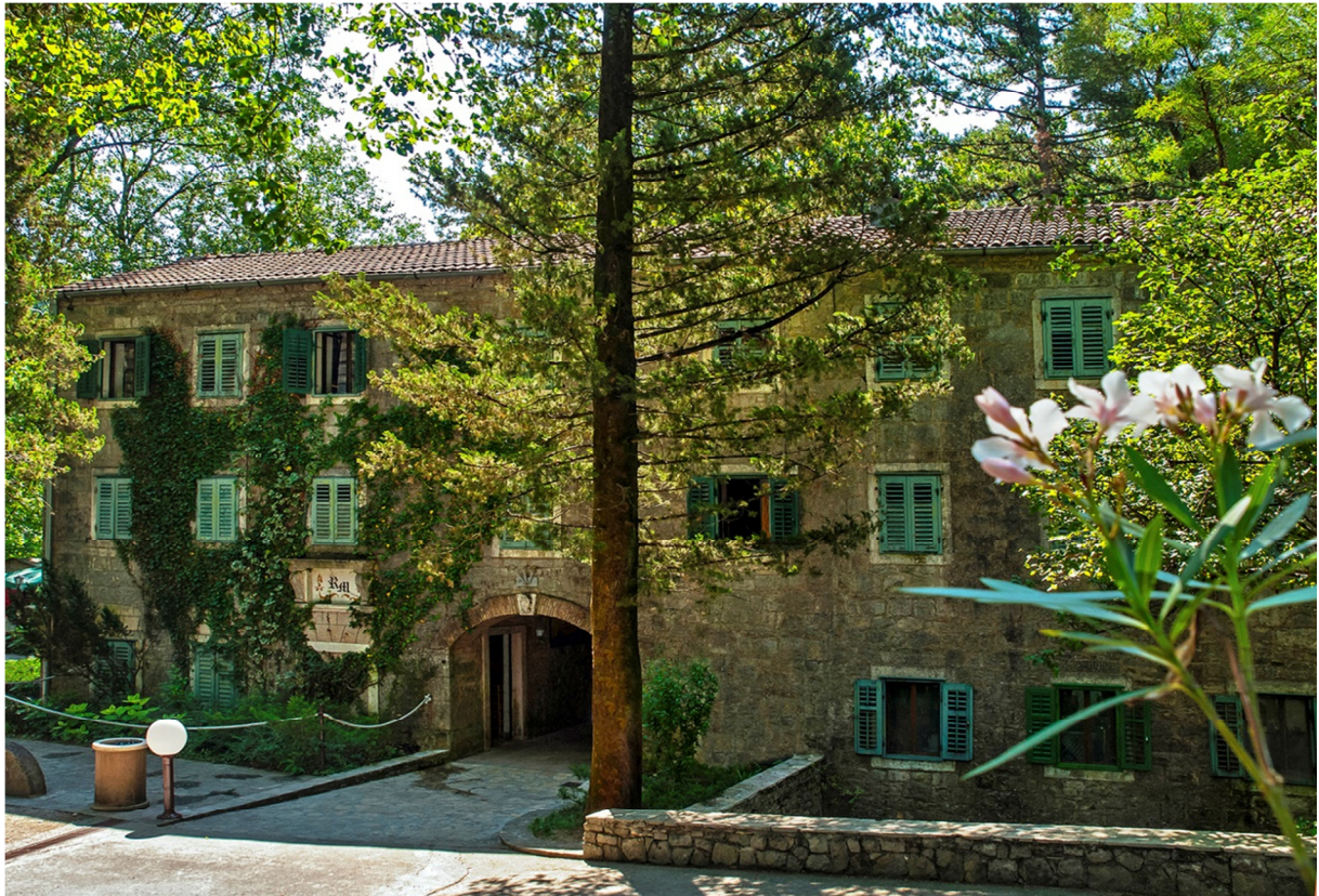
Slika 5. Pansion Radmanove mlinice