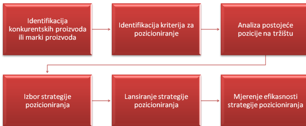
Slika 1. Proces oblikovanja strategije pozicioniranja

Izvor: Izrada autorice prema: 5. Mlivić Budeš, E.(2007.): Pozicioniranje u mislima potrošača, Poslovni savjetnik, dostupno na: www.poslovni-savjetnik.com/sites/default/files/dir_marketing/PS%2030.28.29.pdf [14.12.2016.]