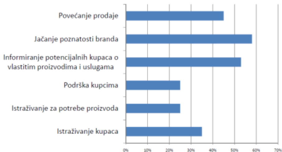
Slika 2. Najčešći ciljevi marketinga na društvenim mrežama

Izvor: Čengiđ, E. (2015): Marketing putem Instagrama na primjeru modnih marki, završni rad, Sveučilište u Zagrebu, Ekonomski fakultet, Zagreb, str. 19.