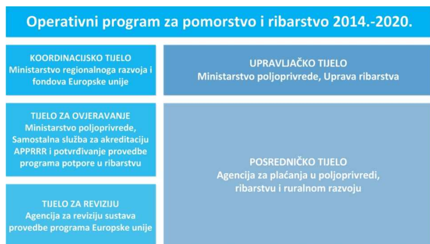
Grafikon 6. Upravljačka struktura OP Pomorstvo i ribarstvo

Upravljačka struktura OP za pomorstvo i ribarstvo je znatno pojednostavljena zbog nepostojanja većeg broja javnih tijela koja sudjeluju u provedbi te je upravljačko tijelo Ministarstvo poljoprivrede, Uprava ribarstva, a provedbeno tijelo obje razine je Agencija za plaćanja u poljoprivredi, ribarstvu i ruralnom razvoju.