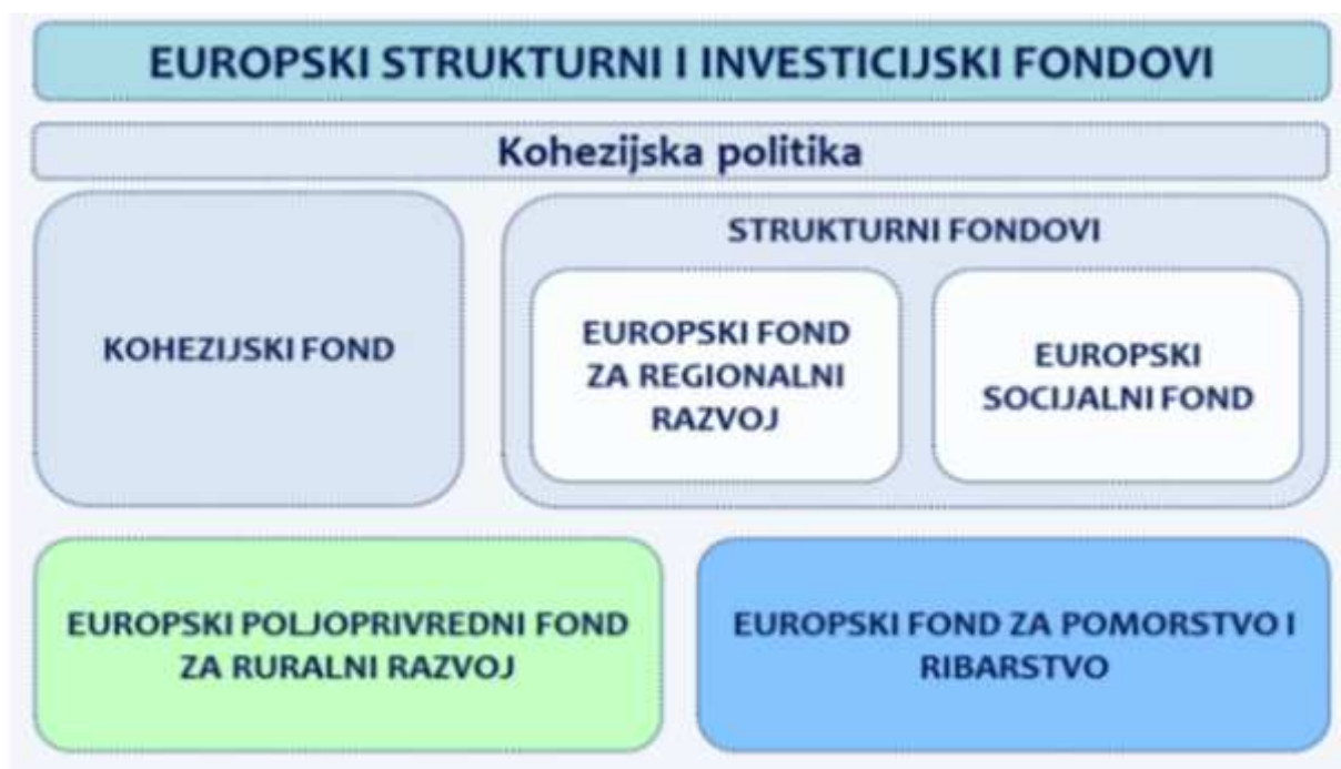
Grafikon 2. Europski strukturni i investicijski fondovi

Europski strukturni i investicijski fondovi Europske unije 2014. – 2020. su primarna metoda koja podržava ostvarenje ciljeva sadržanih u Strategiji Europa 2020. Financiranje kohezijske politike čiji je cilj konvergencija (smanjenje razlika među državama članicama), razvoj konkurencije i regionalni razvoj i prekogranična suradnja osigurava se iz Kohezijskog fonda , Europskog fonda za regionalni razvoj i Europskog socijalnog fonda . U financijskoj perspektivi 2014. – 2020. na raspolaganju zemljama članicama su još dva fonda i to Europski poljoprivredni fond za ruralni razvoj čija je temeljna svrha provođenje Zajedničke poljoprivredne politike (ZPP) i Europski fond za pomorstvo i ribarstvo čija je temeljna svrha provođenje Zajedničke ribarstvene politike (ZRP).