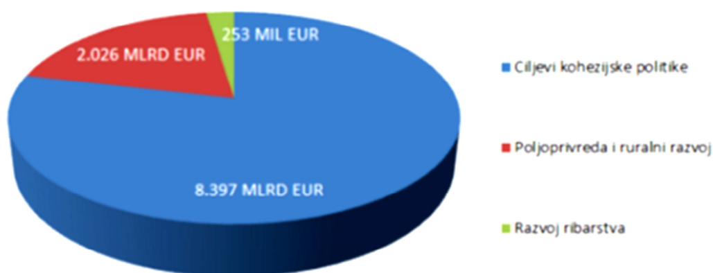
Grafikon 3. Raspodjela sredstava ESI, 2014. – 2020.

U financijskom razdoblju 2014.-2020. Republici Hrvatskoj je iz Europskih strukturnih i investicijskih (ESI) fondova na raspolaganju ukupno 10,676 milijardi eura; 8,397 milijardi eura predviđeno je za ciljeve kohezijske politike, 2,026 milijarde eura za poljoprivredu i ruralni razvoj te 253 milijuna eura za razvoj ribarstva.